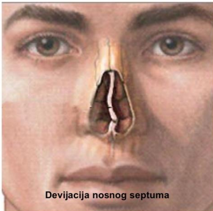
Slika 2. Devijacija septuma

Iskrivljenost nosne pregrade može stvarati neugodne tegobe i takvu pojavu nazivamo devijacijom septuma. Ona je česta pojava i može biti urođena, razviti se tijekom života, te nastati kao posljedica povrede nosa (16). Pacijenti kod kojih je prisutna deformacija nosne pregrade žale se na nazalnu opstrukciju. Prisutnost i stupanj deformacije septuma utvrđuje se prednjom rinoskopijom i endoskopijom (17).