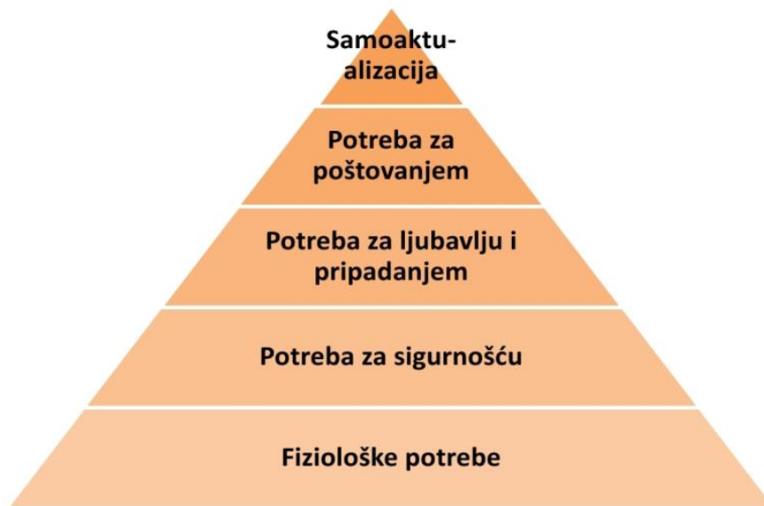
Slika 3. Maslowljeva hijerarhija potreba

samoaktualizacijom zadovoljavaju tek onda kada su zadovoljene sve potrebe na nižim razinama (Slika 3) (15).