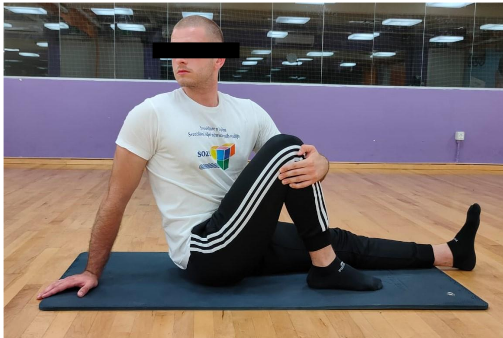
Slika 5. Sjedeća rotacija kralježnice

podlozi u razini koljena druge noge. Rukom obgrliti koljeno noge koja je savijena, a drugu ruku spustiti na podlogu radeći rotaciju u kralježnici. U tom istegnutom položaju ostati 30 sekundi do 1 minute. Disati normalno, a istezanje provoditi oprezno. Postupak ponoviti sa suprotnom stranom [24].