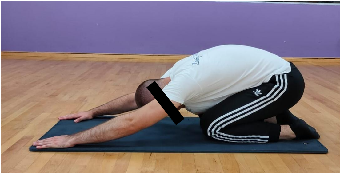
Slika 6. Istezanje leđa na koljenima