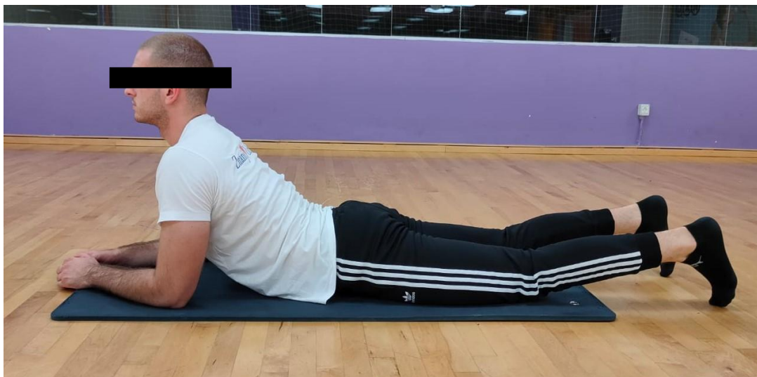
Slika 8. Istezanje u položaju sfinge

Ova vježba se izvodi u ležećem položaju na trbuhu s naslonom na laktove koju su postavljeni u ravnini ispod ramena. Podlaktice su ispružene prema naprijed i dlanovi su na podlozi. Stopala trebaju biti malo razdvojena. Glava i prsa se lagano podižu, a kralježnica se postepeno uvija. Treba pripaziti da se zdjelica ne odiže od podloge. Disati normalno, a položaj zadržati 30 sekundi do 1 minutu [24].