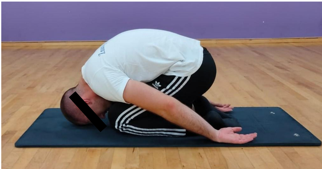
Slika 2. Dječja poza

Sa sva četiri ekstremiteta treba se polako spustiti i sjesti na pete. Čelo spustiti na pod i opustiti ruke uz bokove. Osloniti trbuh na natkoljenice i skoncentrirati se na disanje. Zadržati ovu pozu otprilike jednu minute. Može se ponoviti nekoliko puta tijekom jednog treninga istezanja ili čak između svake sljedeće vježbe istezanja [24].