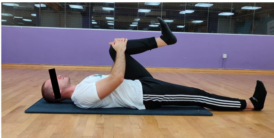
Slika 3. Privlačenje koljena prsima

Ovom vježbom istežu se stražnja loža i gluteusi, ali vježba doprinosi i sustavnoj relaksaciji s obzirom da se provodi na leđima. Ova vježba izvodi se u ležećem položaju na leđima. Potrebno je jednu nogu saviti i obuhvatiti je rukama oko koljena, dok je druga noga priljubljena uz podlogu. Pokušati maksimalno izdužiti leđe i ne odizati kukove. Važno je normalno disati tijekom izvođenja vježbe i zadržati položaj 30-ak sekundi do 1 minutu. Ponoviti isto sa suprotnom nogom [24].