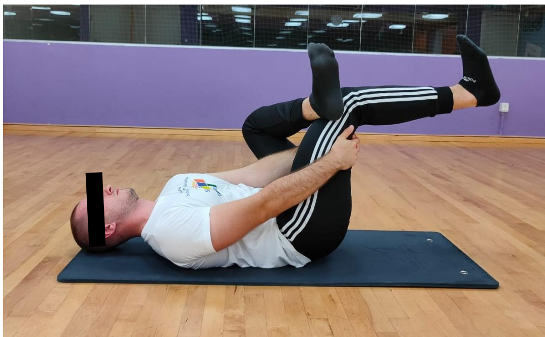
Slika 4. Istezanje piriformisa

Ova vježba se izvodi u ležećem položaju na leđima. Noge su savijene u koljenima. Gležanj jedne noge treba nasloniti na natkoljenu druge noge izvršavajući pritom vanjsku rotaciju u kuku. Nakon toga privlači se prema prsima ona noga na koju je naslonjen gležanj druge noge i zadrži u istegnutom položaju 30 sekundi do 1 minuta. Istezanje treba provoditi sigurno i pažljivo te disati normalno tijekom izvođenja vježbe. Po završetku se preporuča ponoviti postupak s drugom nogom [24].