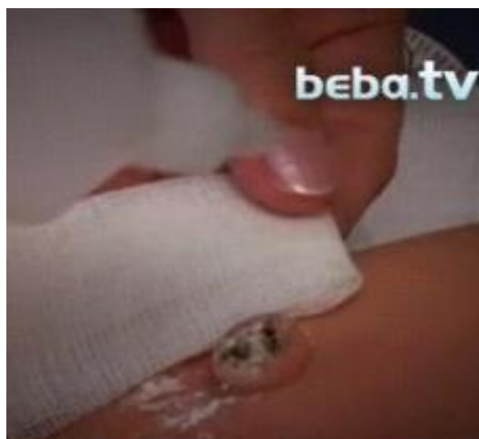
Slika 13. Postupak njege pupčanog batrljka

Zdravo se novorođenče od zdrave majke ne bi trebalo odvajati u rodilištu duže od jednoga sata dnevno i to samo za provođenje potrebnih medicinskih zahvata ili njege.