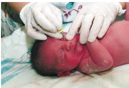
Slika 1-5. Ukapavanje antibiotičkih kapi u oči novorođenčeta ( Jeannette Zaichkin and Debbie Fraser Askin: The healthy newborn )

Gonokokna oftalmija se prevenira ukapavanjem 1%-tne otopine srebrnog nitrata u novorođenčeve oči u prvom satu nakon poroda. Hemoragijsku bolest novorođenčeta sprječavamo ordiniranjem 1 mg vitamina K intramuskularno u novorođenčevu natkoljenicu (26).