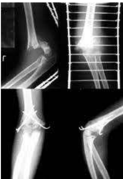
Slika 4. Fiksacija Kirschnerovim žicama

ekstenzijskom tipu prijeloma, koji su već ranije spomenuti. I kod jednog i kod drugog potrebno je žurno imobilizirati ozlijeđenu ruku i bolesnika uputiti na daljnje liječenje, odnosno kliničku obradu radi dijagnostike i terapijskih postupaka. Postoje razne tehnike liječenja. Na primjer, pored već poznate imobilizacije sadrenim zavojem može se koristiti repozicija i perkutana fiksacija ulomaka. Potonje dvije se indiciraju tzv. Kirschnerovim žicama (Slika 4) kada je u pitanju otvoreni prijelom, ireduktibilni prijelom ili u slučajevima motoričkog ili senzornog deficita koji perzistira (11, 30, 31).