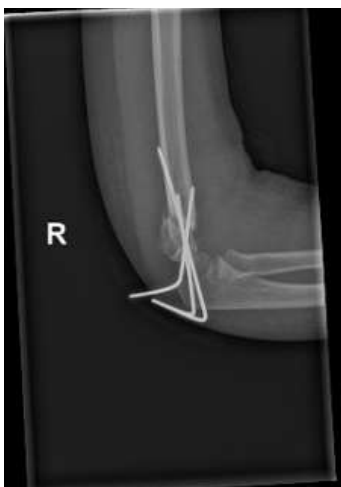
Slika 7 a. Profilna snimka lakta, prvi kontrolni pregled nakon operacije

Nakon otpuštanja iz Klinike kontrolni pregled je obavljen najprije 23. studenog 2022. kada je utvrđeno da je poslijeoperacijski tijek uredan. U odnosu na status same kosti utvrđeno je: otok lakta, mjesta insercija Kirschnerovih žica uredna, napravljena korekcija sadrene nadlaktične imobilizacije s uputom (Slike 7 a i 7 b), te je određena kontrola nakon toga za 7 dana.