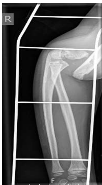
Slika 5b. Profilna snimka lakta nakon pada