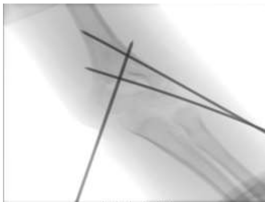
Slika 6 a. AP snimka lakta, perkutano uvedene Kirschnerove žice