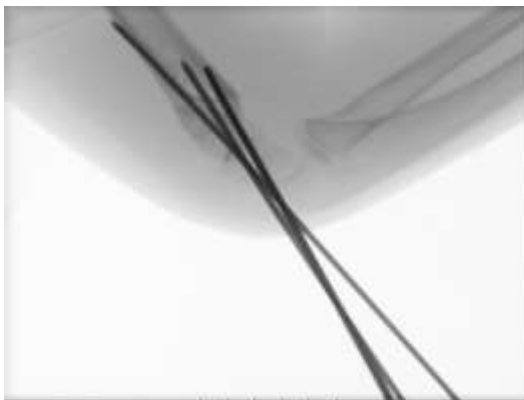
Slika 6 b. Profilna snimka lakta, perkutano uvedene Kirschnerove žice