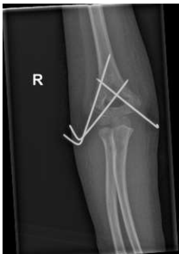
Slika 7 b. AP snimka lakta, prvi kontrolni pregled nakon operacije