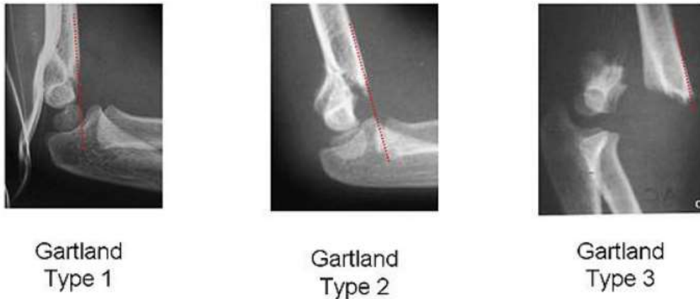
Slika 3. Gartland klasifikacija suprakondilarnog prijeloma nadlaktične kosti