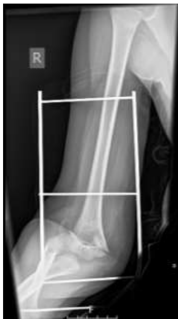
Slika 5 a. AP snimka lakta nakon pada

Djevojčica P. M., rođena 10. srpnja 2016. (dob: 6 godina i 4 mjeseca). Dana 14. studenog 2022., u pratnji roditelja javlja se u hitnu službu te je nakon primarne obrade hitno primljena u Kliniku za dječju kirurgiju, Odjel za dječju kirurgiju i traumatologiju s intenzivnom njegom u KBC-a Split. Razlog prijema bio je suprakondilarni prijelom desne nadlaktične kosti (Slike 5 a i 5 b). Djevojčica je ozljedu zadobila prilikom pada u razini. Nakon pada nastao je otok, bolnost i nemogućnost izvođenja aktivnih pokreta.