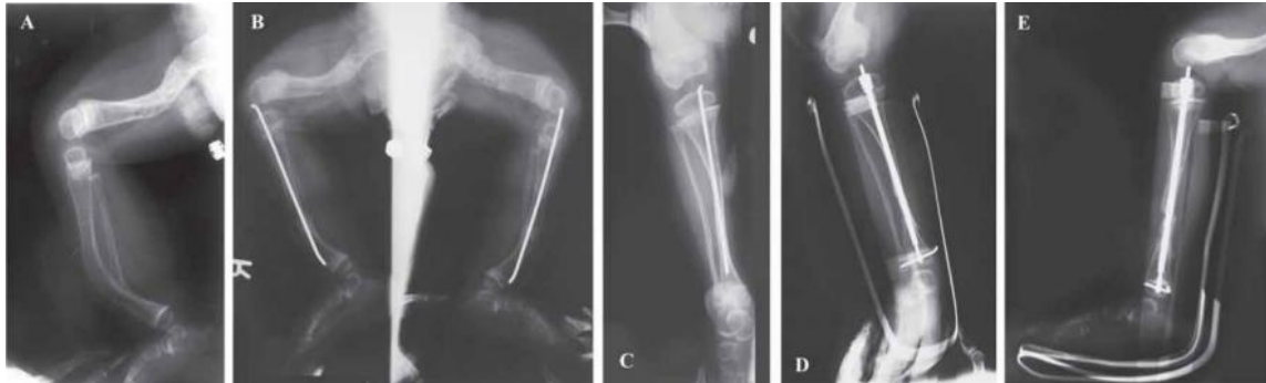
Slika 1. (A) Prijeoperativni rendgenski snimak bolesnika s osteogenesis imperfecta. (B) Postoperativni rendgenski snimak istog pacijenta nakon bilateralne korektivne osteotomije tibije s Kirschnerovim žicama. (C) Ponovljena pojava deformacije dvije godine nakon operacije. (D,E) Rendgenski snimak druge korektivne osteotomije s Fassier-Duval šipkom.

Izvor: Primorac D, Anticević D, Barisić I, Hudetz D, Ivković A. Osteogenesis imperfecta--multi-systemic and life-long disease that affects whole family. Coll Antropol. 2014 Jun;38(2):767-72. PMID: 25145021.