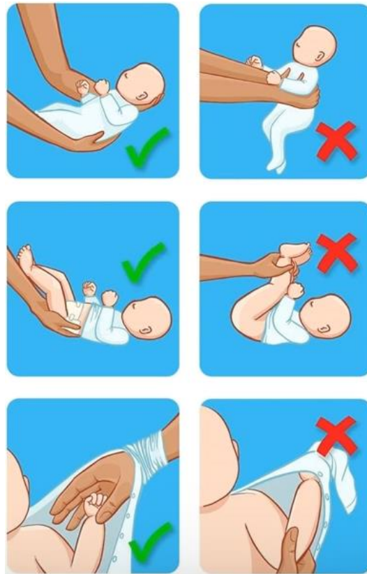
Slika 4. Pravilno postupanje s djetetom s osteogenesis imperfecta