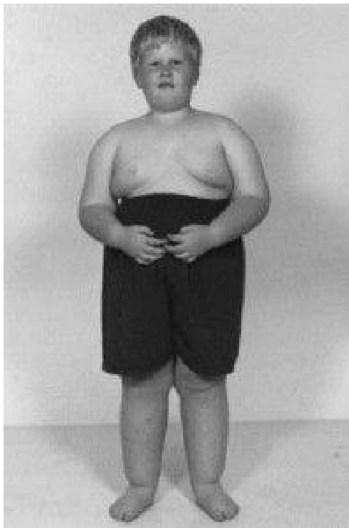
Slika 4: Fizički izgled djeteta s Prader - Willi sindromom