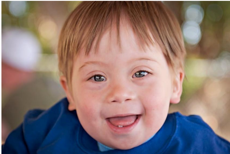
Slika 3: Facijalne karakteristike djeteta s Down sindromom