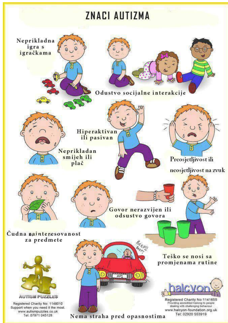
Slika 2. Znakovi autizma