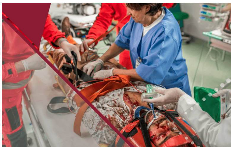
Slika 1. Politraumatiziran pacijent

Politrauma je stanje suprotno od izolirane traume kod koje se javlja ozljeda samo jednog organa. Važan uvjet za korištenje pojma politrauma je pojava traumatskog šoka i/ili hemoragijske hipotenzije te ozbiljno ugrožavanje jedne ili više vitalnih funkcija organizma. Najmanje jedna od dvije ili više ozljeda ili zbroj svih ozljeda ugrožava život politraumatiziranog bolesnika. Evaluacija, liječenje i prognoza politrauma značajno se razlikuju od izoliranih ozljeda (1).