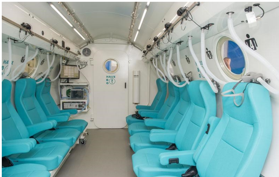
Slika 2. Liječenje HBOT sjedećih pacijenata u barokomori (18)

Kasni simptomi kao posljedice dekompresijske bolesti mogu se javiti i nekoliko godina iza ronjenja. Najčešći su simptomi uporni bolovi u zglobovima i udovima, aseptičke nekroze kosti, motorički poremećaji, periferne neuropatije, povećana sklonost bolestima srca i krvnih žila te neuropsihološki ispadi. Mjesta gdje se liječe nastradali zovu se barokomore. Razlikuju se jednomjesne i višemjesne (2). Kako im samo ime kaže, jednomjesne barokomore su za jednu osobu, u njima nije moguće pregledati pacijenta i u većini se ne može tlačiti iznad tri ATA. Najčešće takve barokomore koriste amateri ronionci i sportaši. Višemjesne barokomore su češće jer u njih može stati više pacijenata. Takve se barokomore koriste u Rijeci i Splitu. Višemjesna barokomora je prikazana na slici 2.