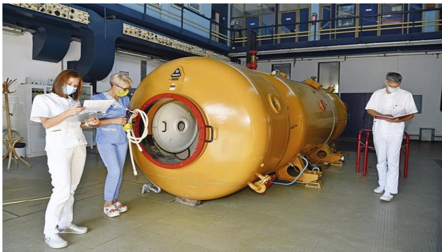
Slika 5. Procjene i protokoli te provođenje mjera sigurnosti (22)

Stoga treba biti uvijek oprezan kada je riječ o dekompresijskoj bolesti. Dekompresijsku bolest može pogoršati nedostatak tekućine i elektrolita u tijelu, a dehidracija koja je u ronilaca posljedicom pojačanog mokrenja. U ronilaca ga izazivaju uronjenost i hladnoća. U slučaju da ronilac ostane pri svijesti, važno je osigurati mu dovoljno tekućine kao što su voda, voćni sok, mineralna voda ili neki drugi dostupni osvježavajući napici.