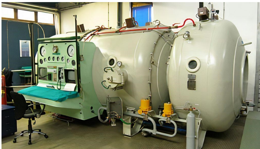
Slika 4. Barokomora danas (21)

Nakon svakog ronjenja ronilac je obavezan izvijestiti zapovjednika o dubini i trajanju ronjenja, o vremenu zadržavanja na različitim dubinama i provedenoj dekompresiji. Zapovjednik je dužan kod svakog kršenja dekompresijskih pravila poduzeti mjere za okončanje profilaktičke dekompresije ili u rekompresijskoj komori ili reimerzijom u vodi (21).