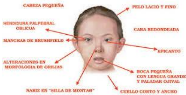
Slika 3. Karakterističan izgled lica kod sindroma Down,