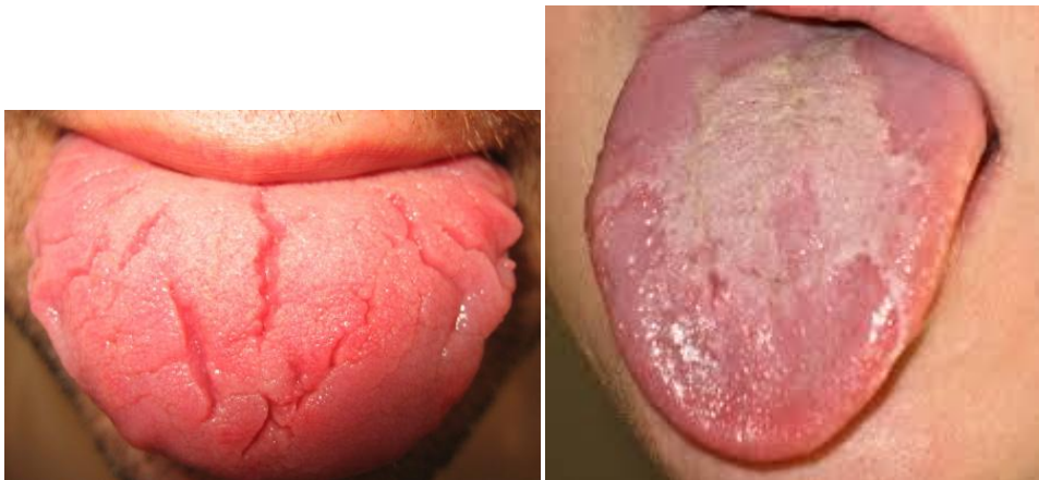
Slika 4. Karakterističan oblik jezika kod SD,