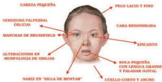
Slika 3. Karakterističan izgled lica kod sindroma Down,