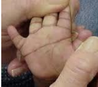
Slika 5. Brazda četvrtog prsta,