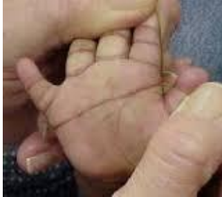
Slika 5. Brazda četvrtog prsta,