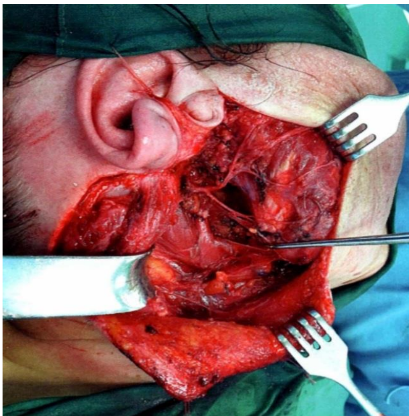
Slika 5. Totalna paroidektomija zbog mukoepidermoidnog karcinoma

Radikalna paroidektomija je totalna paroidektomija s proširenom resekcijom ličnog živca, a uz nju se često izvodi disekcija vrata. Kod proširenih, uznapredovalih tumora ponekad je potrebno proširiti opseg resekcije izvan parotide, što može značiti eksciziju vanjskog slušnog hodnika, uške, resekciju uzlaznog kraka mandibule, luka jagodične kosti ili dijela temporalne kosti (1, 2).