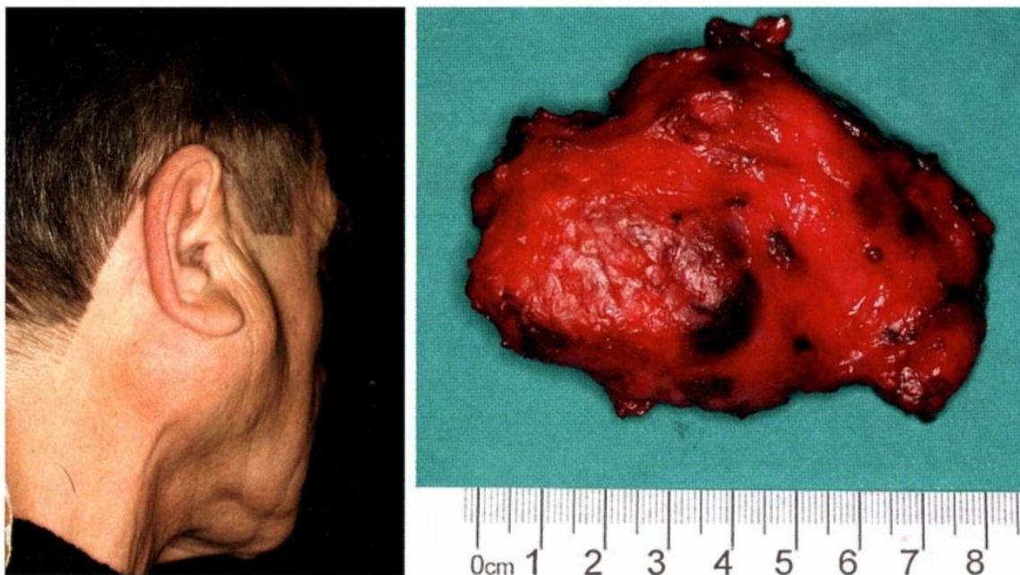
Slika 2. Uznapredovali tumor mikstus desne parotidne žlijezde