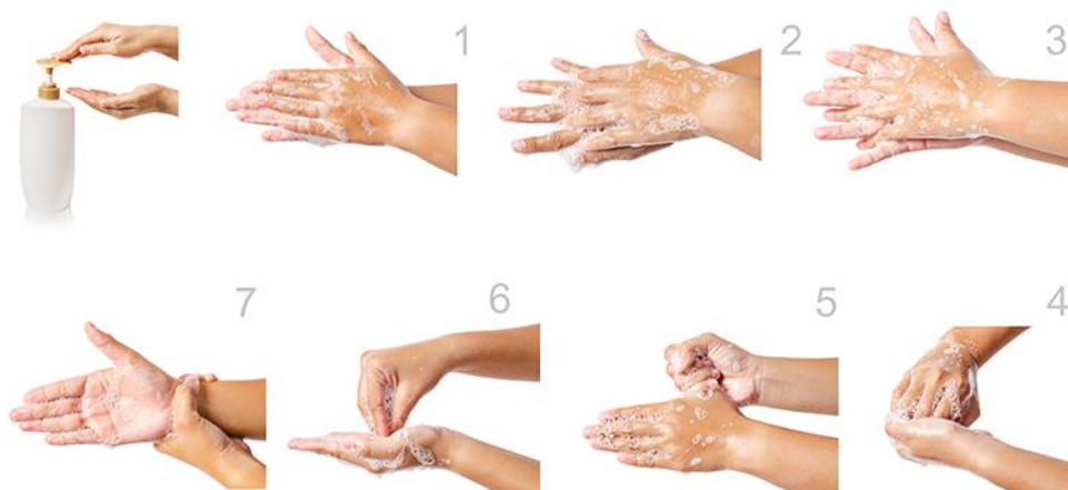
Slika 2. Higijensko pranje ruku (Izvor https://hr.izzi.digital/DOS/112272/115423.html )

Nakon pranja, ruke je potrebno posušiti papirnatim ručnikom, izbjegavati ponovno korištenje istoga ili korištenje ručnika, te s 3 do 5 mL alkoholnog sredstva dezinficirati ruke kojim uklanjamo prolaznu mikrobiotu koja je odgovorna za križne infekcije kao što su E.coli , Klebsiella spp. , C. Difficile i dr. Da bi izbjegli isušivanje ruku, bitno je koristiti pripravke s emolijensom. Kako je ovo brzi postupak, često se primjenjuje u hitnim situacijama kada je potreba za brzom dezinfekcijom, no to ne treba postati navika i zamjena za pranje ruku, jer djelotvornost mu je slabija kod virusa kao što su rotavirusi i enterovirusi. Tri najbitnije komponente alkoholnog pripravka za utrljavanje jesu koncentracija alkohola (60-80%), kontaktno vrijeme (20-30 sekundi) i volumen alkohola. Prvu preporuku za higijensko utrljavanje u ruke daje P. Furbringer 1888. godine. Nepravilnim utrljavanjem i korištenjem dezinficijensa na nedovoljno posušanim rukama povećavamo pojavnost dermatitisa, ali i umanjujemo njegovo djelovanje. Smanjenu pojavnost alergičnog kontaktnog dermatitisa postići ćemo hidratacijom ruku s korištenjem kreme s emolijensom u svrhu sprječavanja