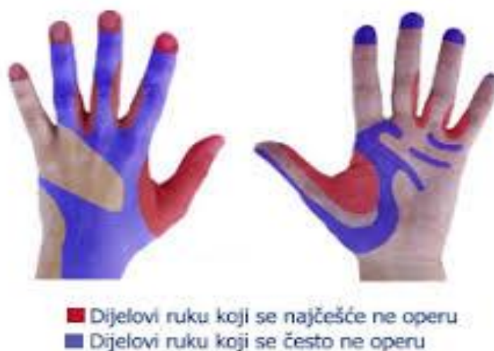
Slika 3. Dijelovi ruke koji su najčešće izostavljeni tijekom dekontaminacije ruku

isušivanja kože. Higijensko utrljavanje u ruke provodimo kroz 30 sekundi, istim kružnim pokretima ruku kao i kod higijenskog pranja ruku (13). Kada bi se zdravstveni radnici pridržavali pravilne higijene ruku, oko 30 % infekcija bi se spriječilo. Osim toga, zdravstvene ustanove moraju biti opskrbljene mjestom za pranje ruku, umivaonicima, potrebnim sapunima, alkoholnim pripravcima i papirnatim ručnicima (3). U bolnici, među osobljem prema istraživanju u Općoj bolnici Nova Gradiška osiromašeno je znanje o pravilnoj higijeni ruku, uključeno je bilo 100 zdravstvenih djelatnika, a rezultati su pokazali da je samo 32 % odgovorilo točno vrijeme potrebno za pravilno pranje ruku, te 52 % ispitanika se slaže da za uklanjanje prolazne mikrobiološke flore dovoljni samo sapun i voda. Većina ispitanika je upoznata o utjecaju dugih noktiju i nošenje nakita na širenje infekcija. Zbog prisutnosti neznanja i neispravnih stavova te zanemarenosti pravilne higijene ruku u zdravstvenim ustanovama potrebno je provoditi edukaciju medicinskih sestara jer su one koje imaju najviše kontakta s bolesnikom (14).