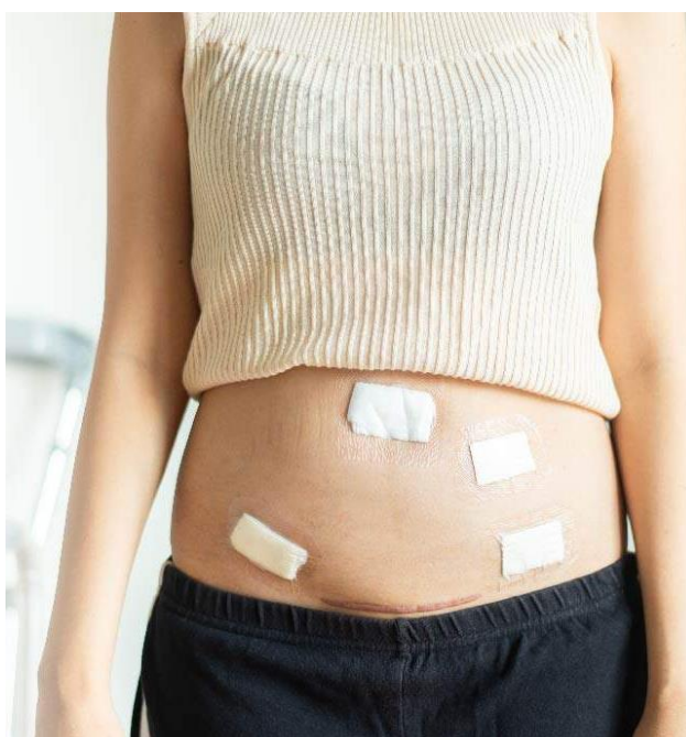
Slika 3. Postoperativne rane endometrioze jajnika

Primalje educiraju pacijentice o pravilne njege nakon operacije kako pravilno negovati postoperativne rane da pravilno zacijele i kako s vremenom vratiti fizičku snagu bez posljedica. Pacijentice se upućuje na važnost redovitih kontrola i liječenja te savjetovanje oko mogućnosti za hormonsku terapiju, koja pomaže u smanjenju rizika od ponovnog pojavljivanja endometrioze jajnika (3). Praćenjem svih savjeta koje primalje daje, pacijentice bi vrlo brzo trebale samostalno nastaviti svoj životni ritam.