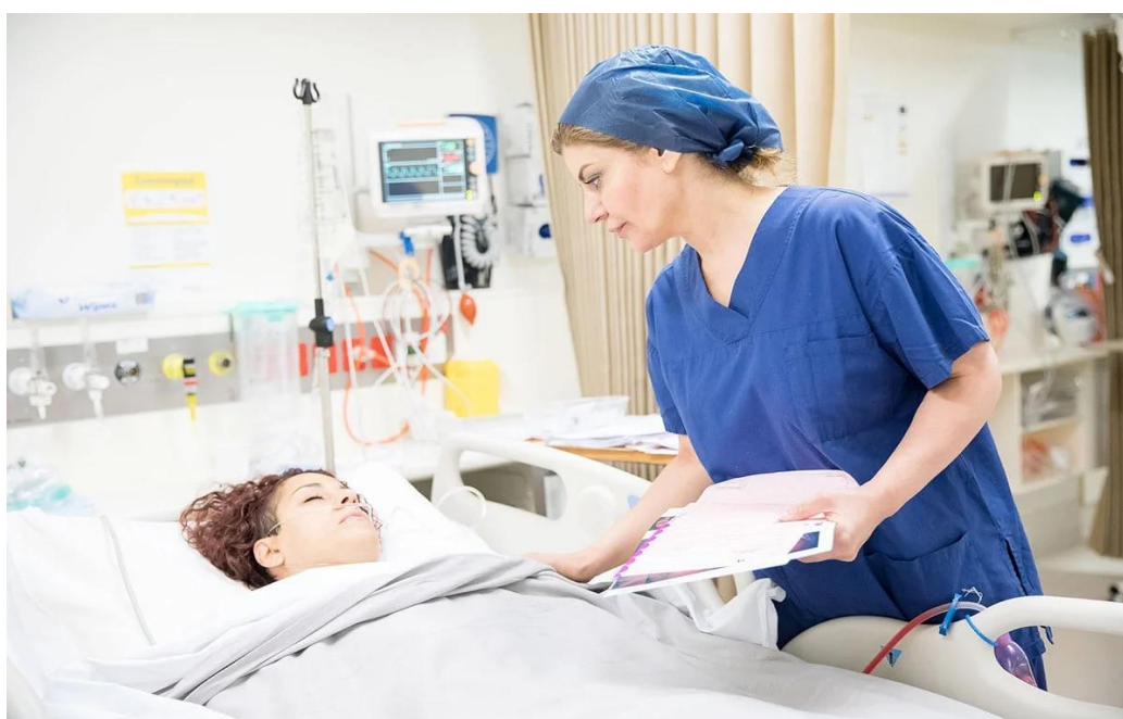
Slika 4. Briga primalje nakon kirurškog tretmana endometrioze

Uloga medicinske sestre za endometriozu nije neprocjenjiva samo u ranim fazama dijagnosticiranja i liječenja, osobito u pogledu podrške pacijentici i savjetovanja, već ona također igra temeljnu ulogu u postoperativnom razdoblju pružajući podršku pacijentici, nudeći im lako dostupnu luku pristajanja i vodeći ih kroz stazu liječenja do uspješnog otpusta. U današnje doba medicinske obuke koja se ne temelji na timu, vrlo je rijetko da pacijenticu pregleda isti mlađi član medicinskog osoblja, pa je stoga kontinuitet skrbi koju nudi medicinska sestra za endometriozu neprocjenjiv (14).