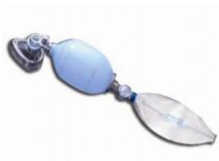
Slika 15. Samošireći balon

To je tehnika koju je potrebno stalno uvježbavati kako bi se vještina očuvala (7).