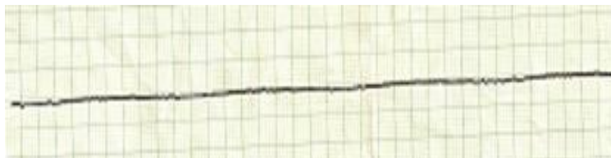
Slika 4. Asistolija

Novi protokoli terapije - elektrostimulacija (defibrilacija) na licu mjesta unose skromni optimizam“ (2).