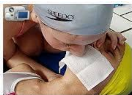
Slika 13. Umjetno disanje usta na usta

Prilikom umjetnog disanja nastoji se izbjeći distenzija (odn. proširenje) želuca i upuhivanje zraka u prostor trbušne šupljine smješten ispod ošita, budući to predstavlja neuspješnu, neadekvatnu ventilaciju i postiže upravo suprotan učinak. Konačno, uspješnost umjetnog disanja procjenjuje se, upravo, opservacijom podizanja prsnog koša prilikom svakog pojedinačnog upuhivanja zraka, kao i promatranjem i osluškivanjem izdisaja, tj. strujanja i ispuštanja zraka iz dišnih puteva i usta u okolinu (11).