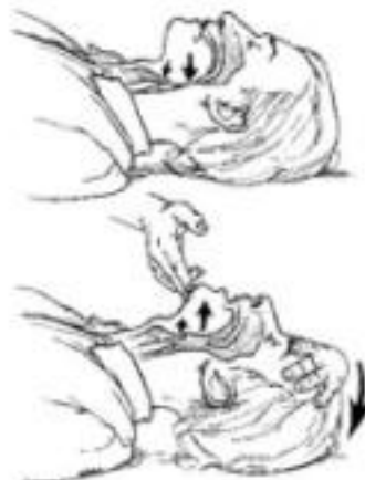
Slika 5. Zabacivanje glave bez ili sa podizanjem brade

Zabacivanjem glave i podizanjem brade prema gore, jezik i donja čeljust se pogurnu prema naprijed što u većini slučajeva otvori dišne putove. Postupak zabacivanja glave i podizanja donje čeljusti treba izbjegavati kod ozljede ili sumnje na ozljedu glave, vrata ili kralježnice (3).