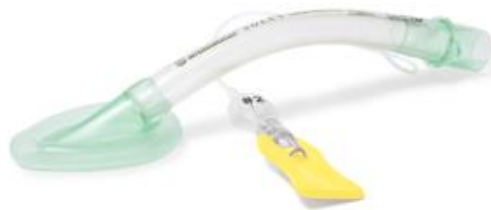
Slika 9. Laringealna maska

Naime, postoje i drugi načini osiguranja dišnog puta koji se puno jednostavnije izvode. Tu se prije svega misli na primjenu supraglotičkih sredstava poput laringealne maske, laringalnog i kombiniranog tubusa, I-gel-a (12).