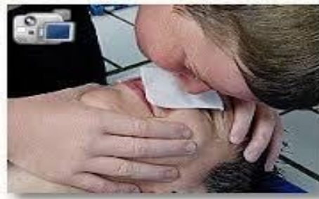
Slika 14. Umjetno disanje usta na nos

Ako umjetna ventilacija nije zadovoljavajuća, treba pokušati korigirati položaj glave unesrećenog, te ju zabaciti jače prema natrag ili snažnije podignuti donju vilicu; ako se ni tada ne postigne zadovoljavajuća ventilacija, treba pomisliti na strano tijelo u dišnim putovima i pokušati ga ukloniti prije spomenutim postupcima (11).