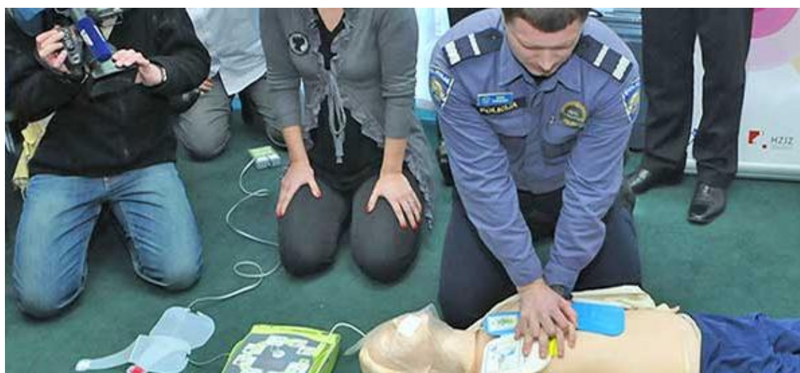
Slika 21. Postupak korištenja AED-a