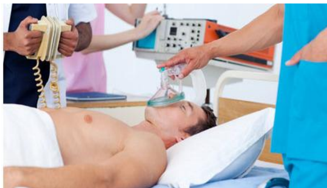
Slika 19. Postupak defibrilacije