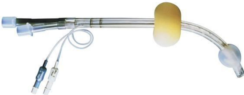
Slika 12. Kombinirani tubus