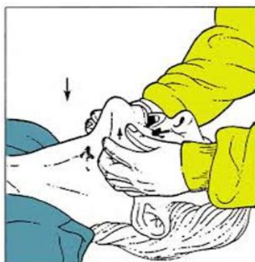
Slika 6. Podizanje donje čeljusti

Podizanje čeljusti se izvodi tako da se stane iznad pacijentove glave i naslone se laktovi na podlogu uz glavu, rukama se obuhvate rubovi donje čeljusti s obje strane i podigne se prema gore bez zabacivanja glave (3).