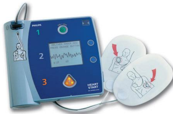
Slika 20. AED

velikog broja ljudi (stadioni, trgovački centri, aerodromi, kolodvori, javna mjesta i sl. ) (11).