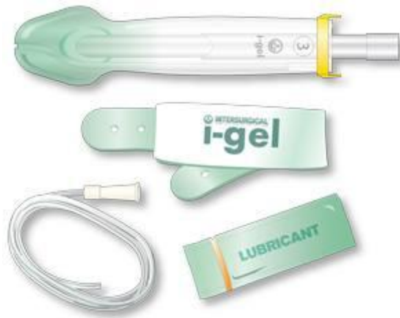
Slika 11. I-gel