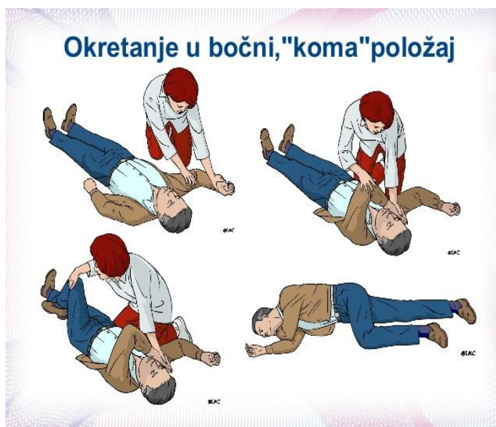
Slika 7. Bočni položaj- tzv. Recovery position

Postupak stavljanja u bočni položaj izvodimo tako što kleknemo sa strane osobe bez svijesti, čije noge moraju biti ispružene. Ruka koja je uz vaše koljeno mora biti savijena pod pravim kutom u laktu u odnosu na tijelo žrtve, a dlan te ruke okrenut prema gore. Ruku osobe bez svijesti koja je na suprotnoj strani povučemo na prsni koš, pri čemu je šaka s dlanom okrenuta prema dolje (na prsni koš). Nakon toga prihvatimo čvrsto donji dio bedra iznad koljena i drugom rukom čvrsto uhvatimo rame i povlačimo nogu prema sebi te onesviještenog okrenemo na bok. Sada donja noga ostaje ispružena, a gornju nogu namješamo da bude pod pravim kutom u kuku i koljenu. Ruku stavljamo ispod obraza kako bi podržavala glavu koja je pomaknuta unazad (4).