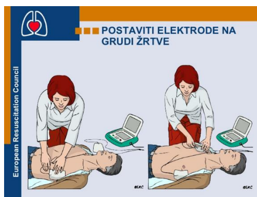
Slika 18. Mjesto postavljanja elektroda defibrilatora

„U izvanbolničkim uvjetima najčešće se koristi antero-lateralni položaj elektroda. Jedna elektroda (obično je označena ili na njoj piše STERNUM) se postavlja ispod pacijentove desne klavikule uz sternum a druga elektroda (također je označena a obično na njoj piše APEX) se postavlja u srednju aksilarnu liniju druge strane pacijentovog prsnog koša otprilike na položaju elektrode V 6 koju koristimo kada radimo 12 kanalni EKG. To je standardni položaj elektroda za defibrilaciju. Naravno možemo koristiti i samoljepljive elektrode postavljajući ih na isti ili na antero-posteriorni položaj“ (10).