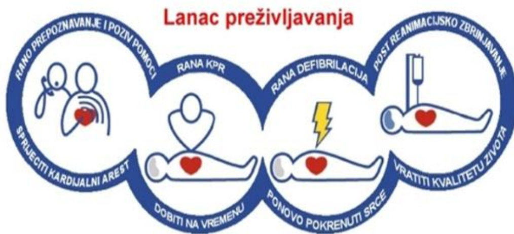
Slika 1. Lanac preživljavanja