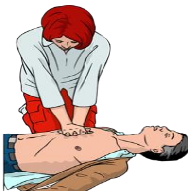
Slika 16. Vanjska masaža srca

Kompresija prsnog koša i opuštanje trebaju jednako trajati i jednakomjerno i ritmički se ponavljati. Poznata je činjenica da se učinkovitim vanjskom masažom postiže samo 25-30, najviše do 40% volumena krvi, to jest karotidnog i cerebralnog protoka, a sistolički tlak se održava nešto većim od 80 mm žive. To je, ipak, sasvim dostatno da se uspostavi cirkulacija organizma i srčana akcija, te obnovi moždani krvotok. Naime, trajno oštećenje mozga nastupa ako je moždana perfuzija manja od 15%, što je duplo manje od količine krvi koja se dostavi učinkovitim KPR-om, pa se masaža srca može izvoditi i nekoliko sati, a da se još sačuva adekvatna cirkulacija (8).