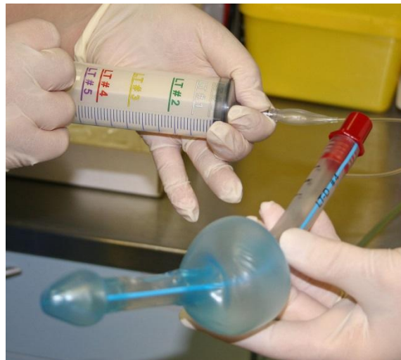
Slika 10. Laringalni tubus