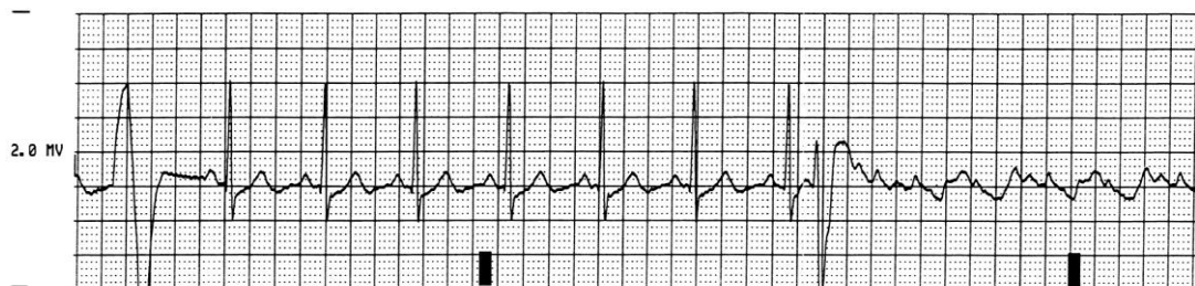
Slika 2. Ventrikularna fibrilacija

Hemodinamski nema mehaničke aktivnosti srca niti cirkulacije krvi“ (2).