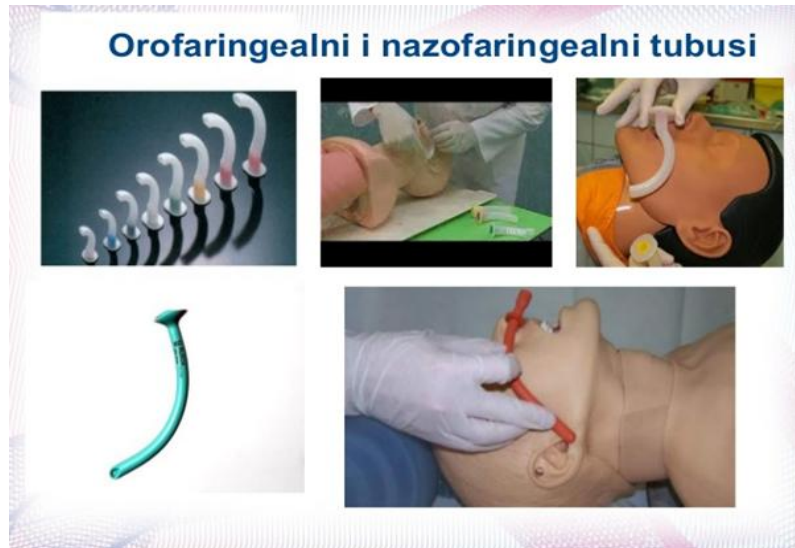
Slika 8. Orofaringealni i nazofaringealni tubus