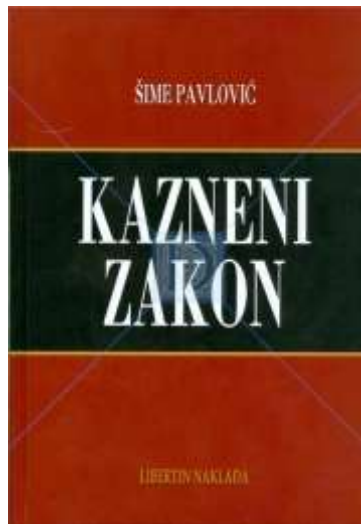
Slika 17. Kazneni zakon Republike Hrvatske u kojem se nalaze gore navedeni članci