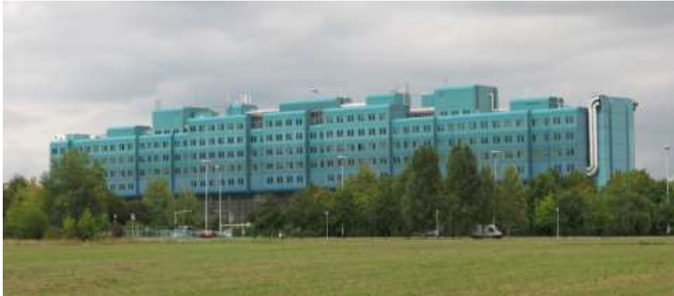
Slika 7. KBC Dubrava u Zagrebu – primjer usluga tercijarne zdravstvene zaštite

Tercijarna zdravstvena zaštita služi za obavljanje visokodiferenciranih (i skupljih) pretraga i terapijskih zahvata. Najčešće rješava najkompleksnije probleme bolesti i bolesnika s teškim i rijetkim bolestima, koji nemaju mogućnost dobivanja pomoći na općinskoj ili županijskoj razini. Tercijarna zdravstvena zaštita pruža se u klinikama, kliničkim bolnicama i kliničkim bolničkim centrima te državnim zdravstvenim zavodima (za javno zdravstvo, za transfuzijsku medicinu, za zaštitu od zračenja, za toksikologiju, za medicinu rada itd.).