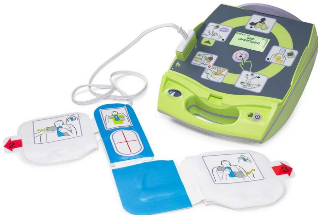
Slika 1. AVD uređaj (72)