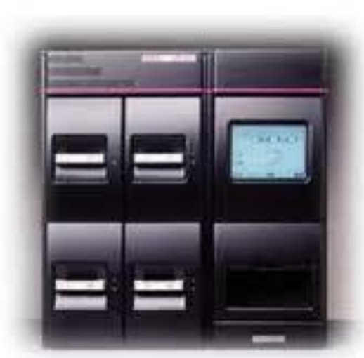
Slika 4. BacT/ALERT 3D automatizirani sustav za hemokulture (11)

Najčešće greške: nije se pričekalo da alkohol ishlapi, prilikom dezinfekcije gumenog čepa bočice ili prilikom dezinfekcije mjesta venepunkcije; palpirala se vena nakon dezinfekcije, a prije venepunkcije.