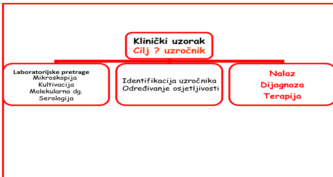
Slika 6. Cilj mikrobiološke obrade uzoraka (7)