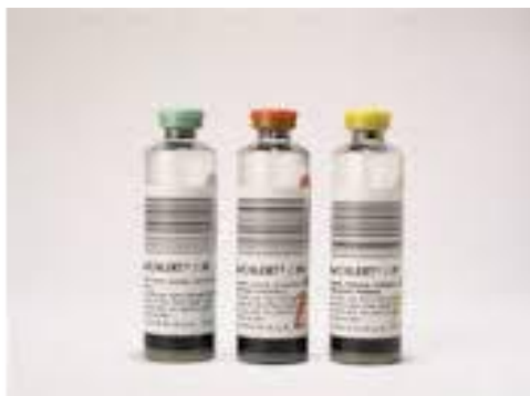
Slika 3. Bočice za hemokulturu (11)