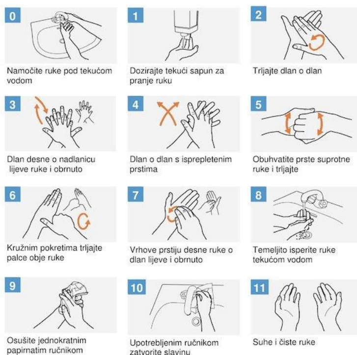
Slika 2. Postupak pranja ruku