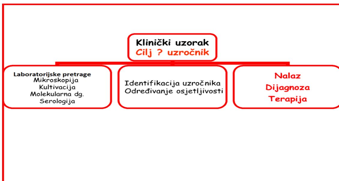
Slika 6. Cilj mikrobiološke obrade uzoraka (7)