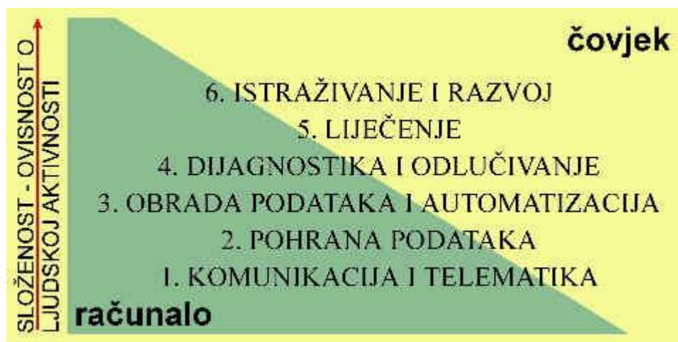
Slika 1. Stupanj primjene računala s obzirom na složenost sustava

Upotreba računala u medicini počiva na težnji da se u svakom pogledu poboljša pružanje medicinske zaštite bolesnicima i to jednako kakvoćom usluga, njihovom količinom i brzinom primjene. Zdravstveni djelatnici u takvom okruženju postupno dobivaju nove zadatke, a djelomično se ili čak u potpunosti razrješavaju nekih poslova, no i dalje ostaju nezamjenjivi. U intelektualnom smislu, posao zdravstvenih djelatnika ulaskom u informatičko razdoblje zapravo ne postaje jednostavniji nego upravo suprotno, složeniji i zahtjevniji. Za pojašnjenje stupnja medicinske znanosti elektroničkim računalima Van Bommel je opisao šest razina njihove primjene: komunikaciju i telematiku, pohranu i pretraživanje podataka, obradu podataka i automatizaciju, dijagnostiku i odlučivanje, liječenje te istraživanje i razvoj. U svakoj od navedenih cjelina računala se rabe, ali nejednoliko, tj. raznolikost njihova korištenja opada s porastom složenosti sustava (slika 1.).