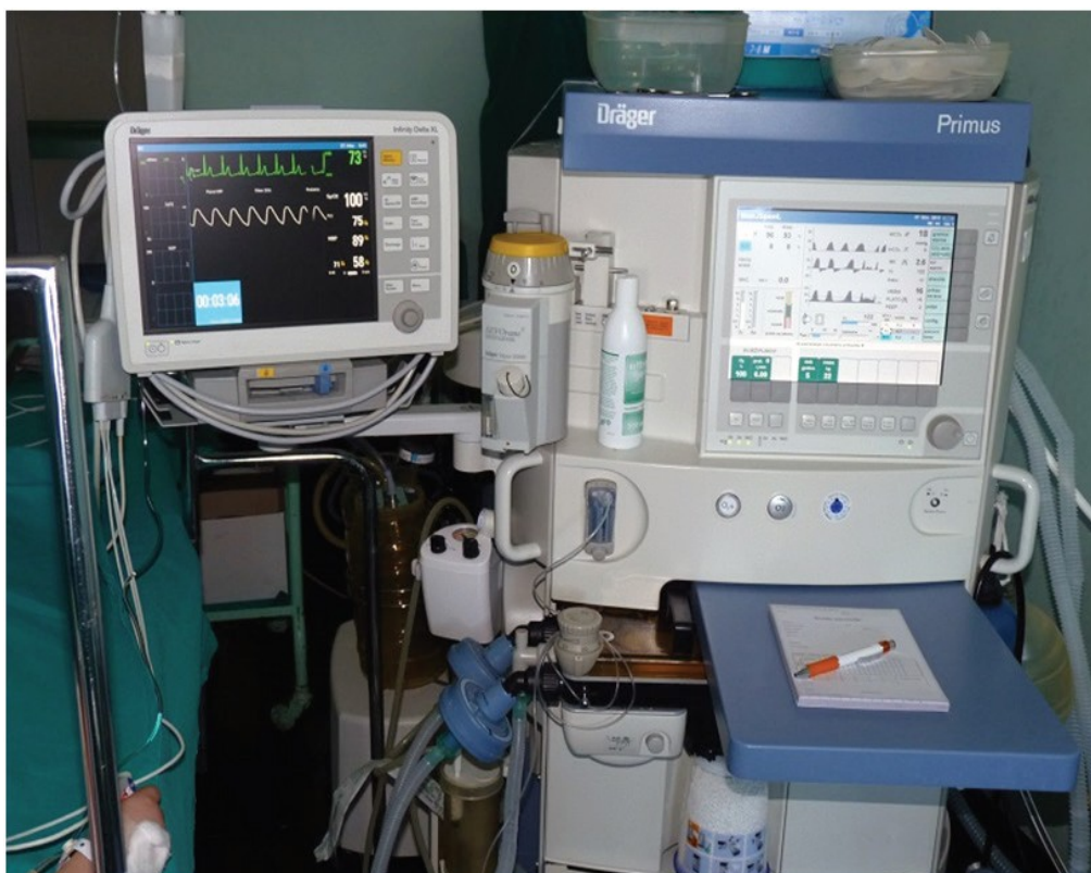
Slika 4. Anestezioološki aparat s monitorima (1)