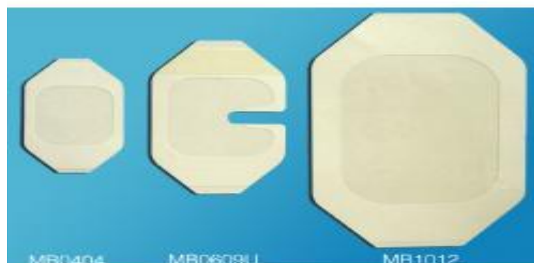
Slika 2. Prikaz „ klasične " pokrivke za SVK

Izvor: DRESSING TRANSPARENT (TEGADERM) I.V. FRAME