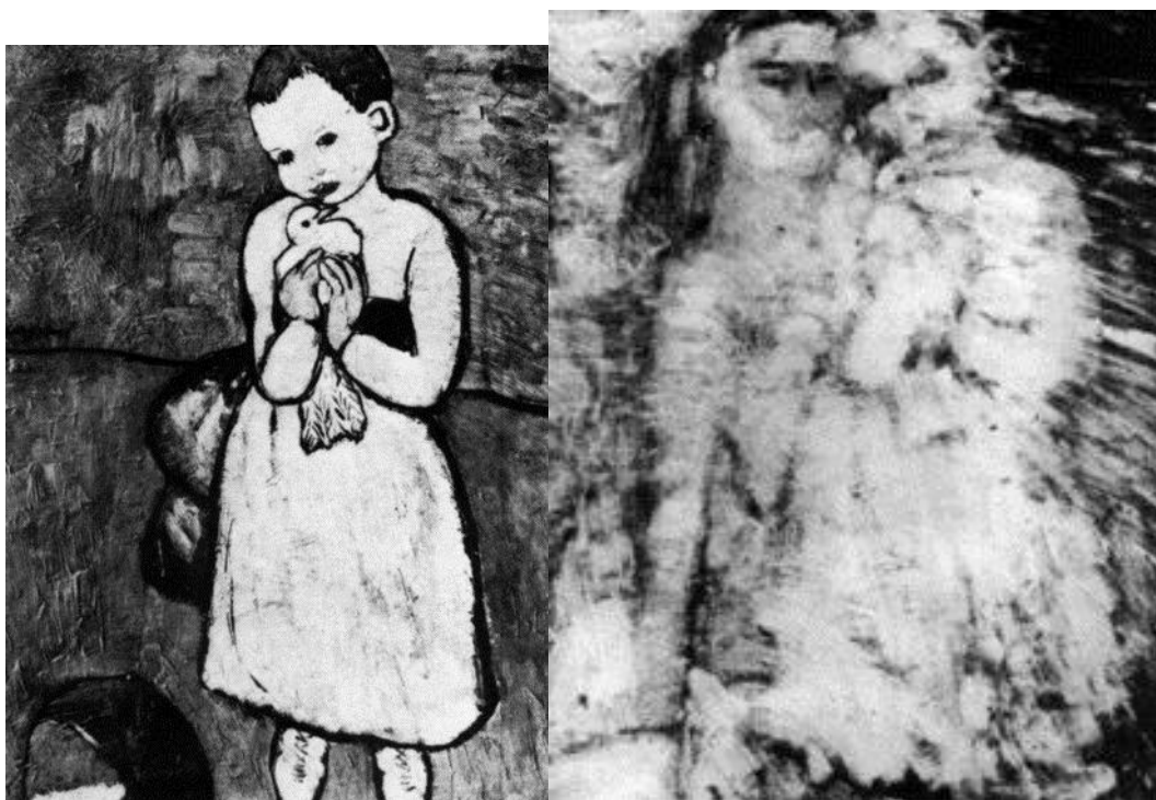
Slika 6. Pablo Picasso: Slika i radiogram slike "Djevojčica s golubom"; Izvor (19)

Na radiogramu (Slika 6.) vidi se da je platno već bilo upotrebljavano. Autor je upotrijebio platno na kojem je već bio nacrtan portret žene. Pomoću radiograma vidi se da oba djela pripadaju istom periodu autorovog stvaralaštva.