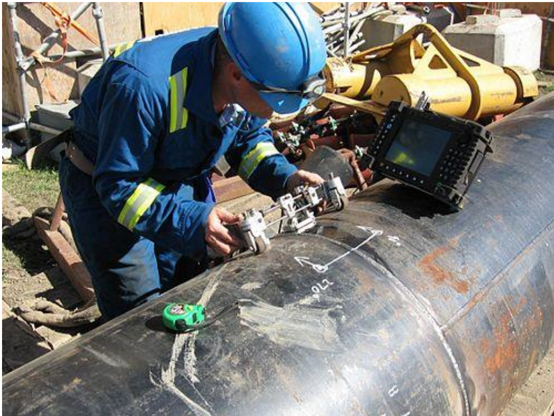
Slika 1. Kontrola kvalitete zavarivanja cjevovoda ultrazvučnim postupkom