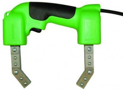
Slika 4. Uređaj za magnetsku kontrolu; Izvor (10)

za 90° da bi se ispitao i u drugom smjeru. Prijenosni uređaji se izrađuju za ispitivanje komada većih dimenzija čije je prenošenje uslijed toga otežano. Magnetizacija ispitivanog komada može se izvesti stalnim ili elektromagnetom. Vršiti se kao djelomična pomoću elektroda kojima se stvara kružno magnetno polje, ili obavijanjem namotaja oko dijela koji se ispituje ako je pogodnog oblika (uzdužna magnetizacija). Poslije završenog ispitivanja magnetizirani dijelovi se moraju razmagnetirati. Razmagnetiranje se vrši u posebnim aparatima ili je u ferofluksu ugrađen poseban uređaj za demagnetizaciju.(7)