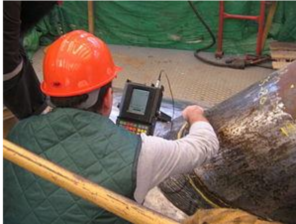
Slika 2. Ultrazvučna kontrola zavara

Poroznost se može javiti po čitavom zavaru. Opasnost predstavlja kada se javljaju u gnijezdima. Ako nastaje pojedinačno, daje nizak i oštar odjek, a ako je poroznost u gnijezdima, dobiva se nizak, širok i jako razgranat odjek.