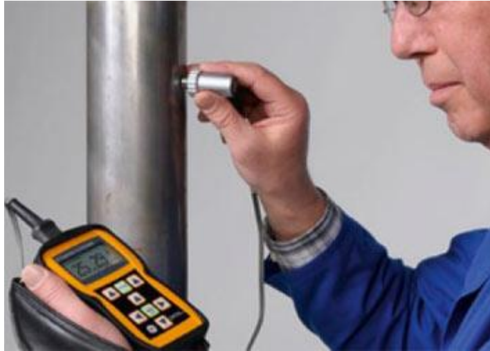
Slika 3. Ultrazvučni mjerač debljine