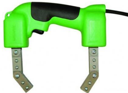
Slika 4. Uređaj za magnetsku kontrolu; Izvor (10)

za 90° da bi se ispitao i u drugom smjeru. Prijenosni uređaji se izrađuju za ispitivanje komada većih dimenzija čije je prenošenje uslijed toga otežano. Magnetizacija ispitivanog komada može se izvesti stalnim ili elektromagnetom. Vršiti se kao djelomična pomoću elektroda kojima se stvara kružno magnetno polje, ili obavijanjem namotaja oko dijela koji se ispituje ako je pogodnog oblika (uzdužna magnetizacija). Poslije završenog ispitivanja magnetizirani dijelovi se moraju razmagnetirati. Razmagnetiranje se vrši u posebnim aparatima ili je u ferofluksu ugrađen poseban uređaj za demagnetizaciju.(7)