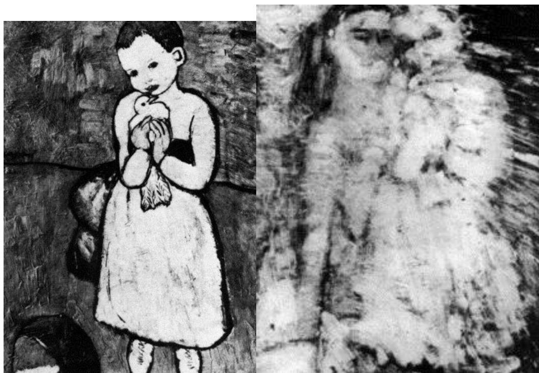
Slika 6. Pablo Picasso: Slika i radiogram slike "Djevojčica s golubom"; Izvor (19)

Na radiogramu (Slika 6.) vidi se da je platno već bilo upotrebljavano. Autor je upotrijebio platno na kojem je već bio nacrtan portret žene. Pomoću radiograma vidi se da oba djela pripadaju istom periodu autorovog stvaralaštva.