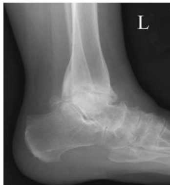
Slika 7. Profilna projekcija stopala sa slabim kontrastom objekta zbog destruktivne bolesti.

Kako bih bile vidljive na radiološkoj slici anatomske strukture moraju imati fizički kontrast u odnosu na okolna tkiva. Kontrast objekta može biti razlika u fizičkoj gustoći ili atomskom broju. Kada je objekt fizički drugačiji upija manje ili više zračenja nego li okolna tkiva iste debljine. Ako objekt apsorbira manje zračenja od okolnog tkiva (plin okružen tkivom), stvoriti će se negativna sjena koju vidimo kao tamno područje na rendgenskom filmu. Također još jedan od čimbenika koji utječu na kontrastnost objekta je njegova debljina. Kontrastnost objekta je proporcionalna produktu gustoće objekta. Kemijski sastav snimanog objekta doprinosi kontrastnosti ako je atomski broj ( Z ) drugačiji od onog u okolnom tkivu. Relativno slab kontrast imamo u mekim tkivima i tjelesnim tekućinama zbog atomskih brojeva čije su vrijednosti jako blizu. Kontrast proizveden zbog razlike u kemijskom sastavu vrlo je osjetljiv na energiju fotona i spektar x-zraka. Materijali koji proizvode visok kontrast u odnosu na okolno meko tkivo razlikuju se od mekog tkiva u fizičkoj gustoći i atomskom broju.