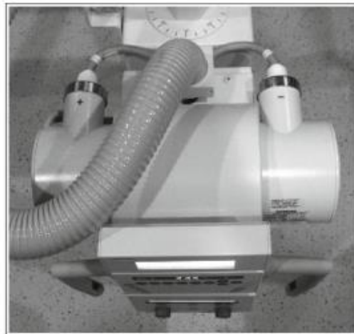
Slika 4. Rendgenska cijeva sa simbolima + za anodu i - za katodu.

postavljajući kraj anode rendgenske cijevi na vrh glave pacijenta. Postavljanje kraja cijevi anode može se razlikovati u napomeni pacijentu kako je i cijev pomaknuta u horizontalni položaj. Za identificiranje kraja anode i katode rendgenske cijevi trebamo locirati + i – simbole prikačene na kućište cijevi gdje ulazi električno napajanje. Simbol + koristi se za prepoznavanje kraja cijevi anode, a simbol – ukazuje na kraj katode (Slika 4).