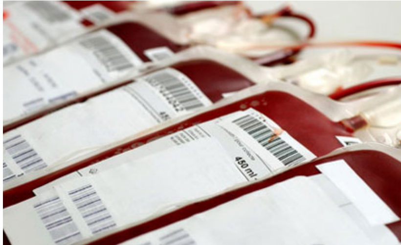
Slika 1. Vrećice za prikupljanje krvi