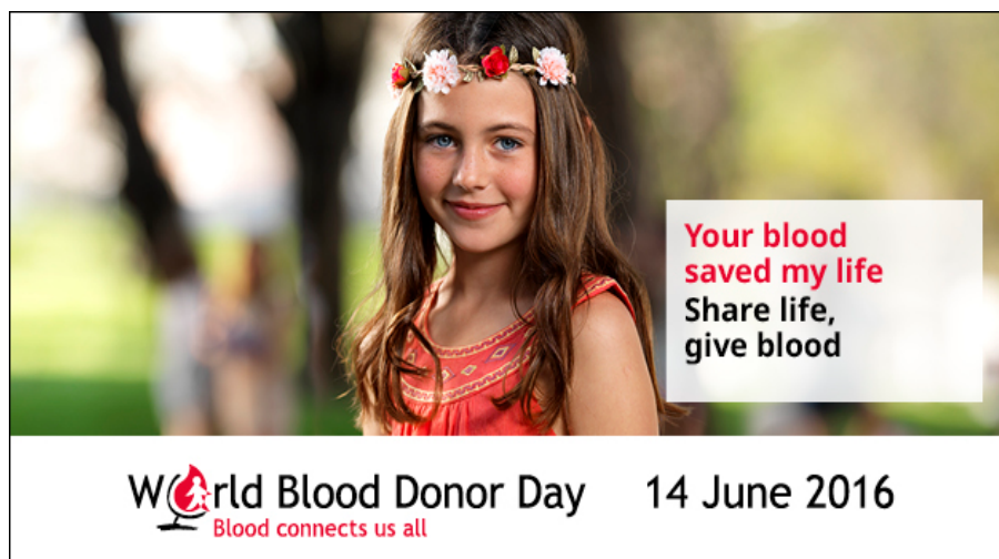
Slika 3. Svjetski dan darivatelja krvi

Pravilnikom o krvi i krvnim sastojcima od 16. prosinca 1998. (NN 14/99) u čl. 9, u stavku 2 je propisano da darivatelj krvi mora biti državljanin Republike Hrvatske (8). Svake godine 14. lipnja se obilježava Svjetski dan darivatelja krvi (Slika 3).