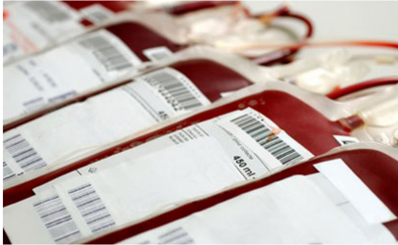
Slika 1. Vrećice za prikupljanje krvi