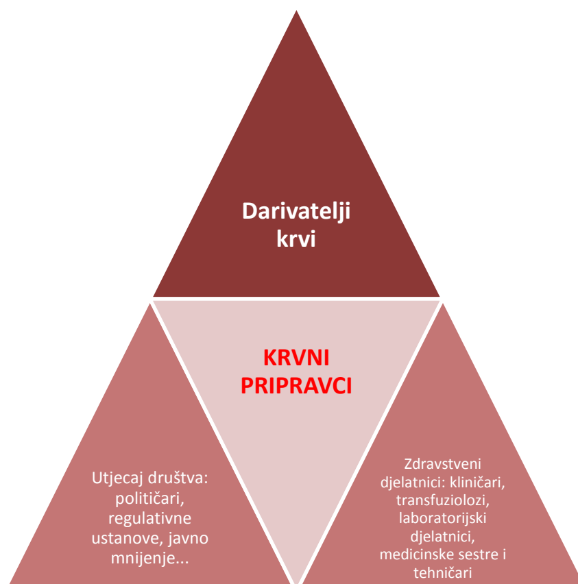
Slika 2. Dinamički transfuzijski trokut (1)

Dobrovoljni davatelj krvi je posredan, ali aktivan sudionik u liječenju bolesnika, tj. on je aktivna veza između zdravog dijela društva i bolesnika (1). Transfuzijska je medicina struka pod stalnim utjecajem i u ravnoteži između interesa davatelja, zdravstvenih djelatnika te želja i mogućnosti društva (Slika 2) (1).