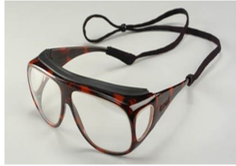
Slika 5. Zaštitne naočale