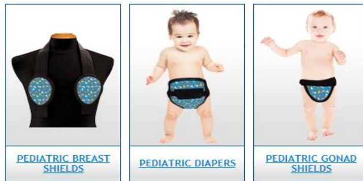
Slika 8. Štitnik za gonade i prsi djevojčica