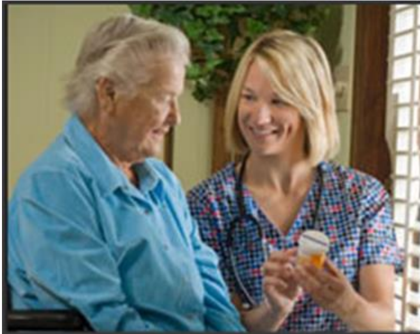
Slika 3. Pomoć starijim osobama oslabljenog sluha