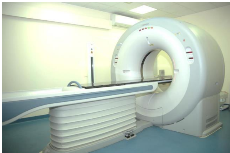
Slika 3. CT simulator

CT simulatori su, u pravilu spiralni CT uređaji kod kojih se snimanje vrši kontinuiranom rotacijom rentgenske cijevi i detektora u jednom smjeru oko pacijenta. Rendgenski snop opisuje spiralu oko pacijenta i omogućuje kontinuirano volumno snimanje tijela, što je vrlo važno za 3D rekonstrukciju, neophodnu za planiranje radioterapije. Za planiranje radioterapije mogu se koristiti i MR i PET/CT, ali uvijek u kombinaciji sa CT-om jer svi moderni sustavi za računalnu simulaciju radioterapije računaju dozu pomoću CT-broja (10). CT simulacija u radioterapiji ima višestruku ulogu: simulacija i resimulacija liječenja, lokalizacija tumora i zdravog tkiva, dizajniranje i pozicioniranje radioterapijskih snopova te evaluacija terapije. Ovakvim sustavom moguće je odrediti terapijsku dozu u bilo kojoj točki u prostoru. Time je moguće precizno odrediti položaje i ekspoziciju terapijskih polja, uz maksimalnu zaštitu zdravog tkiva. Slika 3 prikazuje CT simulator.