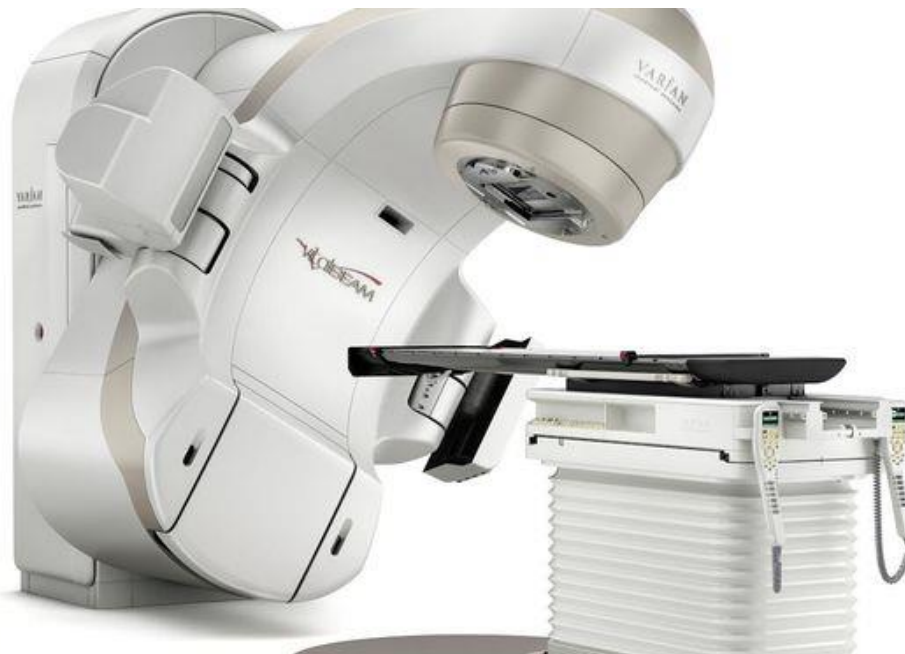
Slika 4. Linearni akcelerator

Radioterapijske tehnike koje omogućuju homogenu distribuciju zadane doze zračenja u ciljnom volumenu uz minimalnu dozu u okolnim strukturama osjetljivih tkiva nazivaju se konformalna radioterapija. Unutar 3D konformalne radioterapije razvijane su različite tehnike zračenja kojima su smanjene doze na organe od rizika. Stoga vanjska radioterapija (EBRT, eng. External Beam Radiotherapy ) isporučuje zračenje koristeći višestruka konformalna polja ili volumetrijske tehnike modulirane intenzitetom, kao što je IMRT ili VMAT.