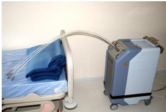
Slika 5. Brahiterapijski uređaj

Brahiradioterapija je vrsta zračenja u kojoj se radioaktivni izvor aplicira u tijelo bolesnika, u područje koje se treba ozračiti, najčešće u izravni kontakt sa tumorom. Ova tehnika omogućuje predavanje vrlo visokih doza malom ciljnom volumenu, uz maksimalnu poštedu okolnog zdravog tkiva. Temelj prednosti brahiterapije jest zakonitost opadanja zračenja s kvadratom udaljenosti. Tehnološki razvoj potaknuo je zanimanje za brahiradioterapiju. Naime, razvijeni su i usavršeni tzv. afterloading uređaji koji omogućuju aplikaciju radioaktivnih izvora u tijelo nakon što se ranije postave „ležišta“ za izvor. Ovom tehnikom omogućena je potpuna zaštita radioterapijskog osoblja od štetnog zračenja. Slika 5 prikazuje „afterloading“ brahiterapijski uređaj.