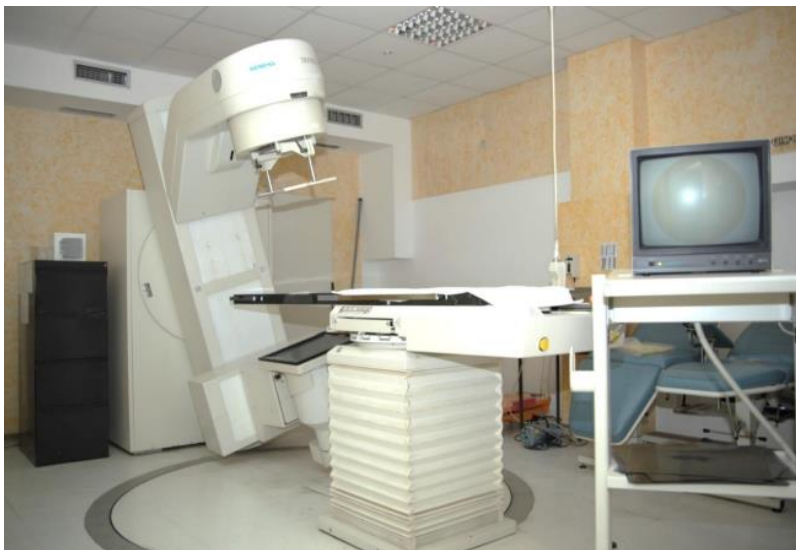
Slika 2. Klasični radioterapijski simulator (preuzeto sa:

Pojavom CT simulatora i uvođenjem 3D tehnika planiranja i provođenja radioterapije, klasični radioterapijski simulator se sve manje koristi pri planiranju radioterapije, te se u modernim radioterapijskim centrima koristi isključivo u planiranju jednokratnih hitnih palijacijskih tretmana (10). Slika 2 prikazuje klasični radioterapijski simulator