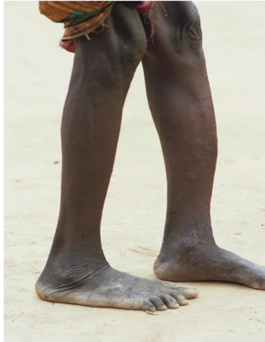
Slika 6: Sabljaste goljениčne kosti