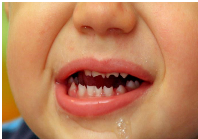
Slika 3: Hutchinsonovi zubi