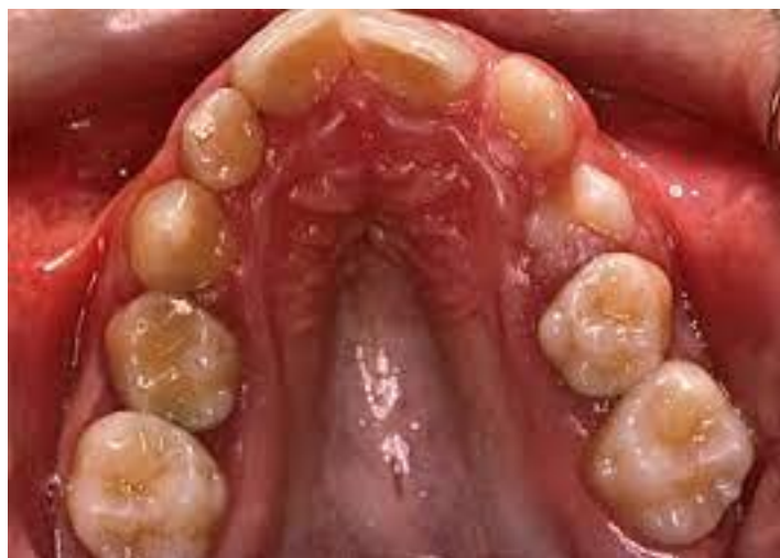
Slika 4: Gotsko nepce