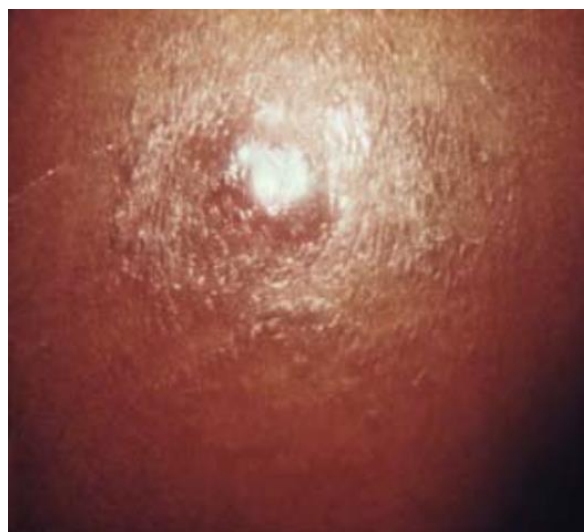
Slika 2. Kožna lezija u bolesnika u primarnom stadiju sifilisa dijagnosticirana nakon mikroskopije u tamnom polju.

U slučaju prijenosa infekcije spolnim kontaktom, na sluznici nastaje primarni afekt poznat kao ulcus durum (tvrđi čankir) (3,10,11). Progresija navedene promjene prolazi kroz faze; od tamno crvene makule, do inflamirane papule u čijem središtu nastaje bezbolni ulkus (3,10,11).