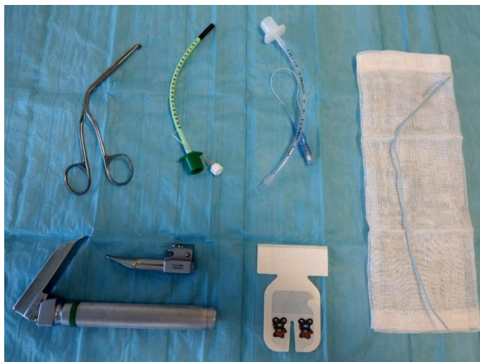
Slika 6. Set za intubaciju

(Magill-ova kliješta, endotrahealni tubusi, žica-uvodnica, traka za fiksaciju s mečičima, laringoskop s ravnim oštricama u dvije veličine- od gore lijevo u smjeru kazaljke sata prema dole lijevo)