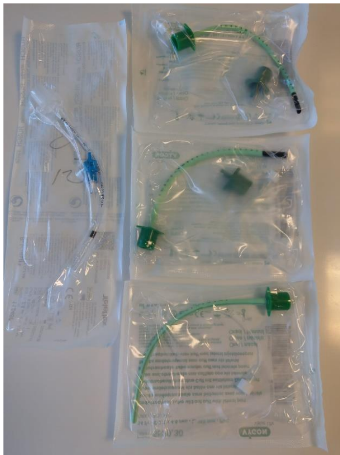
Slika 5. Zapakirani tubusi različitih veličina, lijevo s cuffom, desno bez cuffa

Ambu balon s maskom (Slika 7. i 8.) neizostavan je dio opreme tijekom neonatalne reanimacije i ventilacije (25).