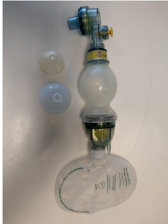
Slika 8. Ambu balon s cirkularnim maskama različitih veličina