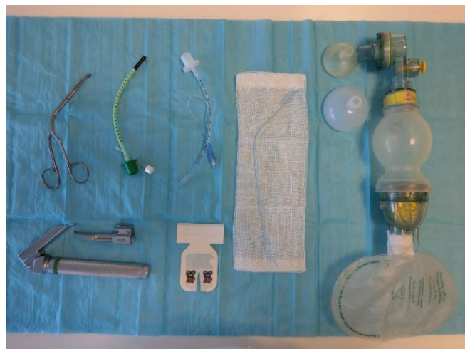
Slika 7. Set za intubaciju + ambu balon s maskom