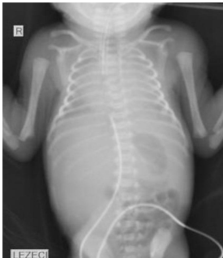
Slika 3. RTG- babygram novorođenčeta s NRDS-om

RTG snimke prikazuju tipične znakove NRDS-a kao što su smanjeni plućni volumen i retikulogranulirani crtež odnosno slika mliječnog stakla (Slika 3.) (4). Pored dijagnostičke primjene, one služe i za potvrđivanje položaja endotrahealnog tubusa.