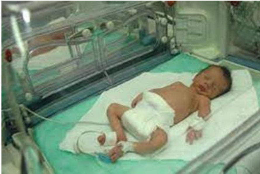
Slika 1. Vanjske karakteristike nedonoščadi