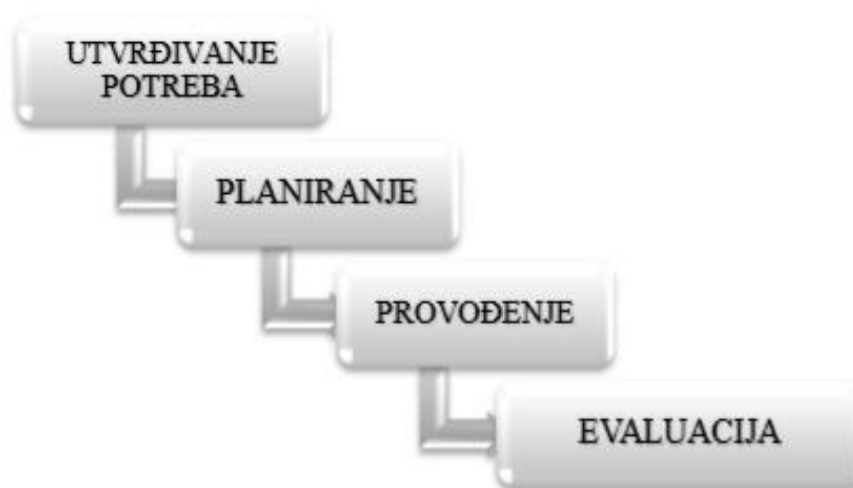
Slika 6. Faze procesa zdravstvene njege

Evaluacija je sustavna, planirana usporedba pacijentovih problema prije i poslije sestrinskih intervencija, a sastoji se od evaluacije ciljeva i evaluacije planova zdravstvene skrbi (17).