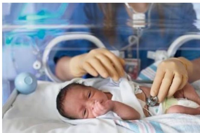
Slika 1-1. Nedonošče

Nedonošeno dijete ima nježnu građu tijela. Spontana motorika mu je neznatna, glasić mu je slabašan, rijetko plače. Zbog slabijeg mišićnog tonusa leži opušteno s opruženim okrajinama. Prsni koš je mekan pa se područje donje trećine prsne kosti pri udisanju uvlači. Koža je tanka i mekana, bez lanugo dlačica, tamnoružičasta ili svijetloružičasta, prozirna. Na dorzumu tabana i dlanova česti su edemi. Uške su mekane i plosnate i bez karakteristična reljefa, osobito se zapaža da gornji rub uške nije uvrnut. Bradavice dojki su jedva uočljive, areola nema ili su jedva naznačene, a palpacijom se ne nalazi tkivo dojke. U muške nedonoščadi testisi su u ingvinalnom kanalu, a u ženske velike usne ne pokrivaju male (6).