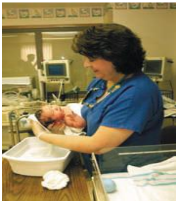
Slika 1-4. Kupanje novorođenčeta ( Jeannette Zaichkin and Debbie Fraser Askin: The healthy newborn )

Kupanje je način provjere djetetova odgovora na podražaj. Stabilno novorođenče se kupa u prva dva sata života. Cilj kupanja novorođenčeta je smanjenje mogućnosti infekcije putem kontakta s majčinim izlučevinama. Međutim, kupanje ćemo odgoditi kod nedonošćadi, novorođenčadi niske porodne mase, bolesne novorođenčadi te loše adaptirane novorođenčadi.