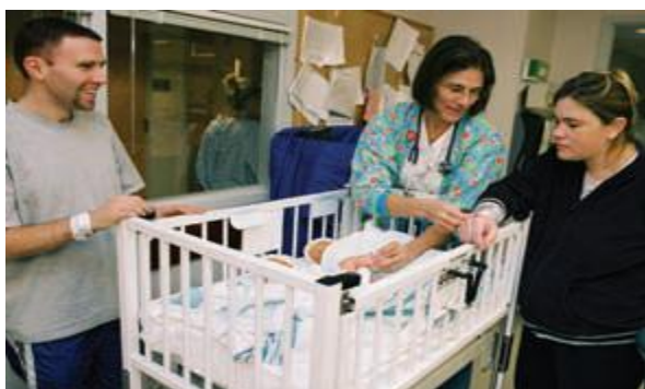
Slika 1-2. Sestra provjerava identifikacijske brojeve majke i djeteta kako bi bila sigurna da su jednaki

Identični identifikacijski brojevi napisani su za majku i dijete s informacijama, uključujući majčin bolnički broj, djetetov spol te datum i vrijeme poroda. Sestra stavlja jednu narukvicu s brojevima na majčino zapešće i obično jednu na novorođenčetovo zapešće i gležanj. Sestra mora usporediti identifikacijske brojeve majke i djeteta kako bi se izbjegle pogreške.