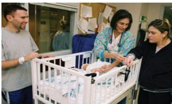
Slika 1-2. Sestra provjerava identifikacijske brojeve majke i djeteta kako bi bila sigurna da su jednaki

Identićni identifikacijski brojevi napisani su za majku i dijete s informacijama, uključujući majćin bolnićki broj, djetetov spol te datum i vrijeme poroda. Sestra stavlja jednu narukvicu s brojevima na majćino zapešće i obićno jednu na novorođenćetovo zapešće i gležanj. Sestra mora usporediti identifikacijske brojeve majke i djeteta kako bi se izbjegle pogreške.