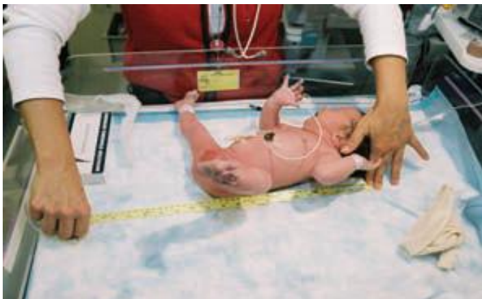
Slika 1-3. Mjerenje duljine novorođenčeta ( Jeannette Zaichkin and Debbie Fraser Askin: The healthy newborn )