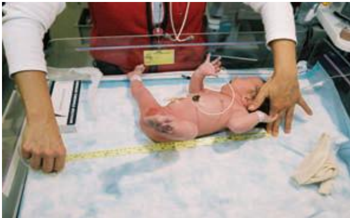
Slika 1-3. Mjerenje duljine novorođenčeta ( Jeannette Zaichkin and Debbie Fraser Askin: The healthy newborn )