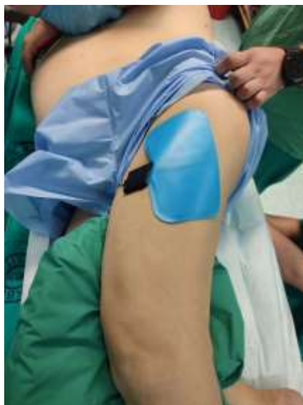
Slika 6. Mjesto postavljanja neutralne elektrode za elektrokoagulaciju

Izvor: autorski rad mentora i pristupnice