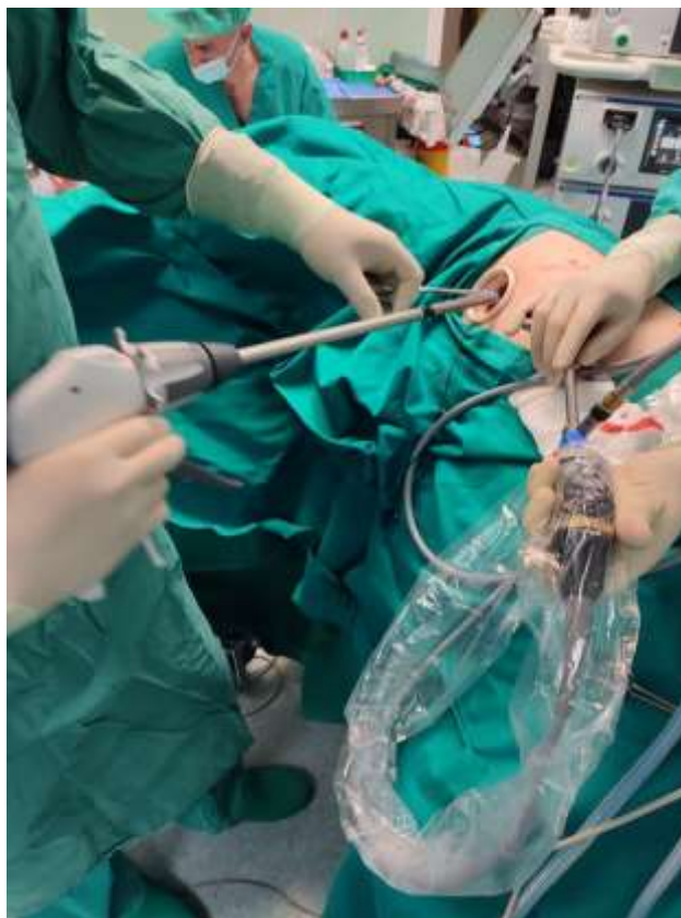
Slika 1. Prikaz izvođenja videotorakoskopije