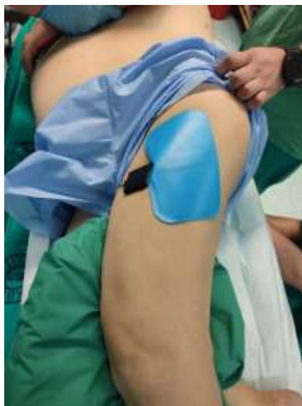
Slika 6. Mjesto postavljanja neutralne elektrode za elektrokoagulaciju

Izvor: autorski rad mentora i pristupnice