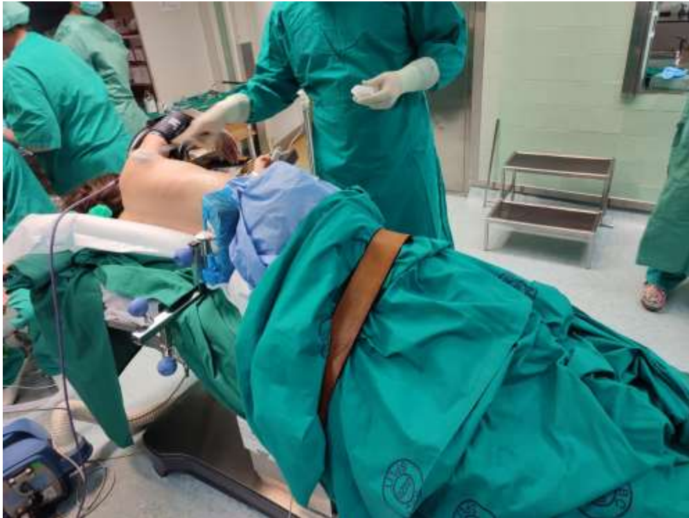
Slika 4. Položaj bolesnika za videotorakoskopiju

Na kraju operacijskog zahvata u toraks se postavlja drenaža ili torakalni drenovi prema želji kirurga.