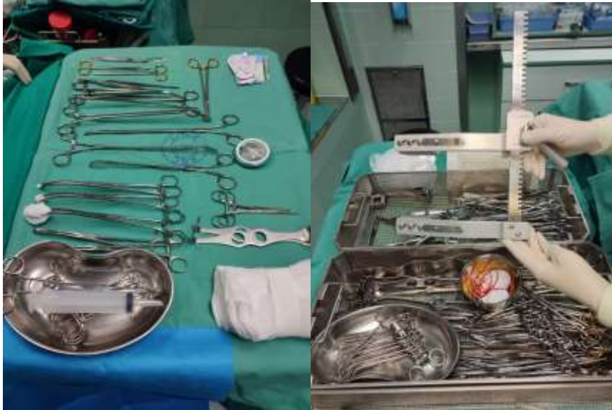
Slika 5. Priprema instrumenata