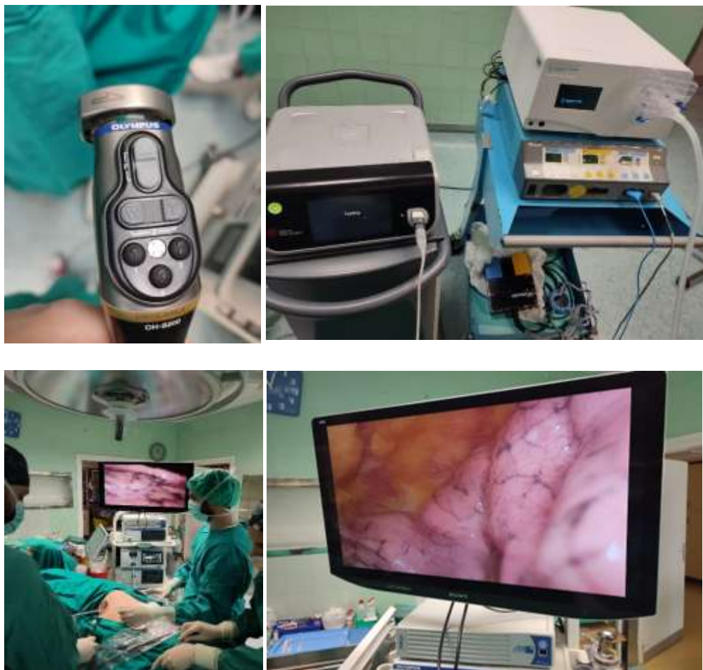
Slika 2. Prikaz opreme za videotorakoskopiju, prijenos slike za vrijeme VATS-a