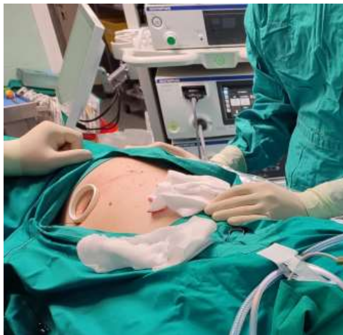
Slika 7. Prikaz otvora za VATS