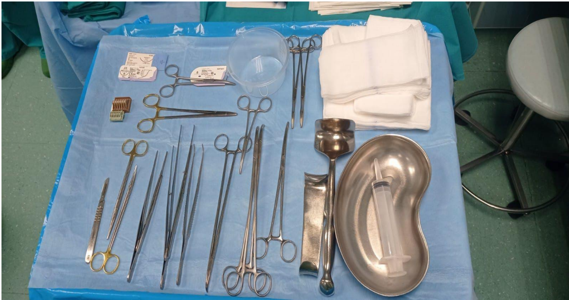
Slika 4. Stol za instrumentiranje.