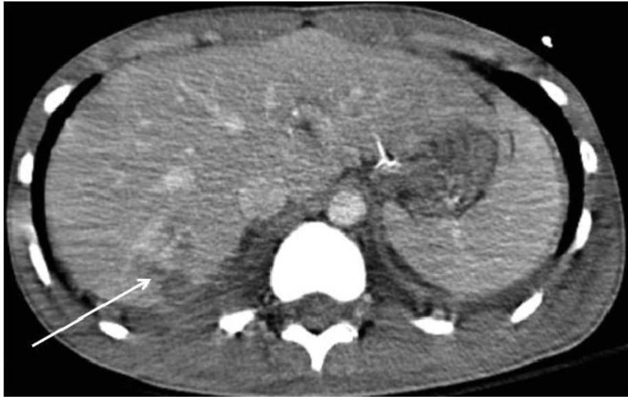
Slika 3. Nepenetrantna ozljeda jetre. CT prikaz.