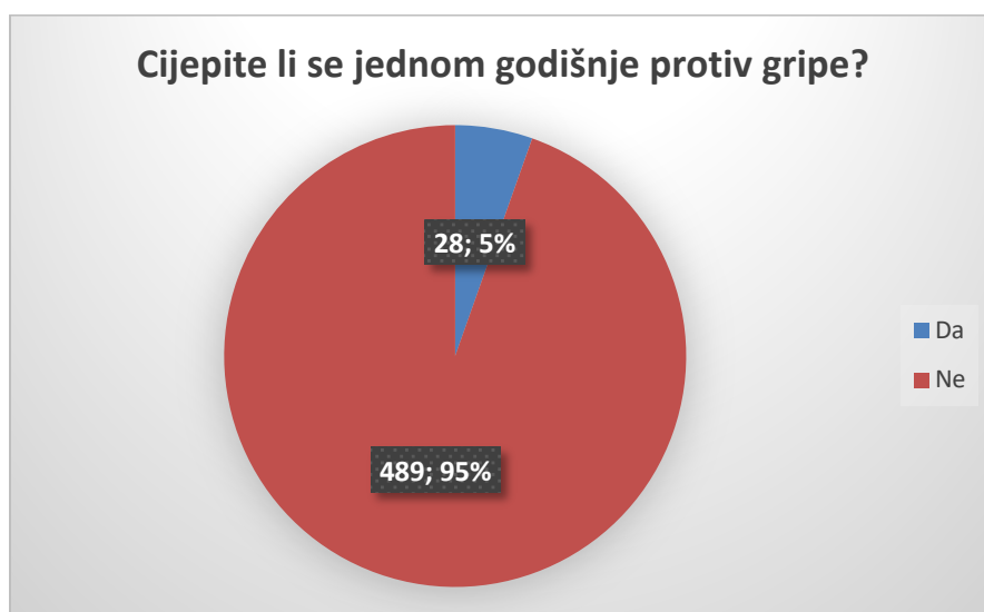
Slika 3. Ponašanja roditelja vezana za godišnje cijepljenje protiv gripe

Od ponašanja vezanih za cijepljenje ispitano je godišnje cijepljenje protiv gripe te odgoda dječjeg cijepljenja i odluka o necijepljenju u slučajevima koji nisu bolesti i alergije. Također je ispitano i koliko ispitanika želi da im dijete primi sva preporučena cjepiva. Velika većina ispitanika (94,6 %) ne cijepi se godišnjim cjepivom protiv gripe, odnosno tek 5,4 % ispitanika se cijepi godišnjim cjepivom protiv gripe (Slika 3).