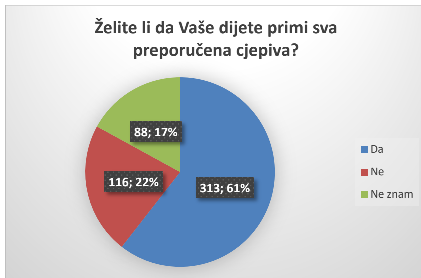
Slika 6. Želja roditelja da dijete primi sva preporučena cjeviva

Pokazalo se da 60,5 % ispitanih roditelja želi da njihovo dijete primi sva preporučena cjeviva, odnosno da 22,4 % roditelja to ne želi, dok je najmanji udio ispitanih roditelja koji ne znaju odgovor na to pitanje, točnije njih 17 % (Slika 6).