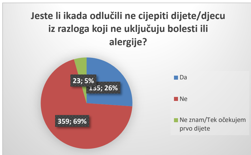
Slika 5. Ponašanja roditelja vezana za necijepljenje iz razloga koji ne uključuju alergije ili bolesti

Pokazalo se da 60,5 % ispitanih roditelja želi da njihovo dijete primi sva preporučena cjeviva, odnosno da 22,4 % roditelja to ne želi, dok je najmanji udio ispitanih roditelja koji ne znaju odgovor na to pitanje, točnije njih 17 % (Slika 6).