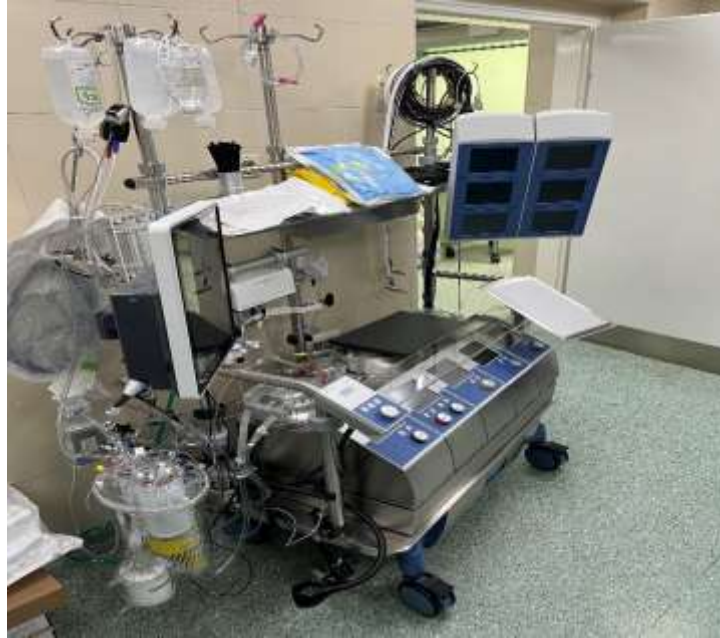
Slika 1. Prikaz stroja za izvantjelesnu cirkulaciju KBC-a Split