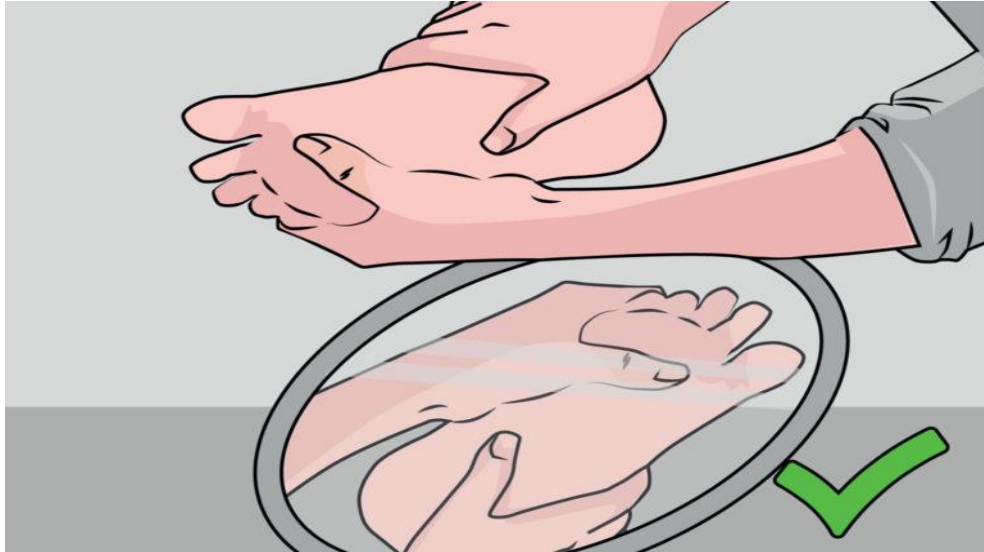
Slika 5. Pregled stopala uz pomoć ogledala