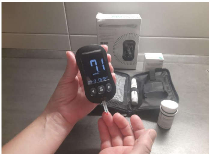
Slika 4. Mjerenje glukoze u krvi uz pomoć glukometra