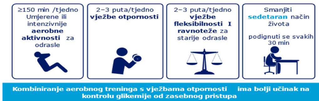
Slika 2. Preporuke o fizičkoj aktivnosti prema ADA standardima liječenja.