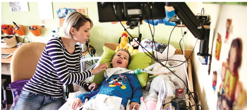
Slika 3: Dijete s traheostomom u kućnom okruženju