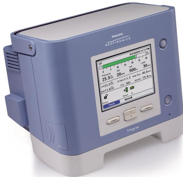
Slika 4: Model kućnog respiratora