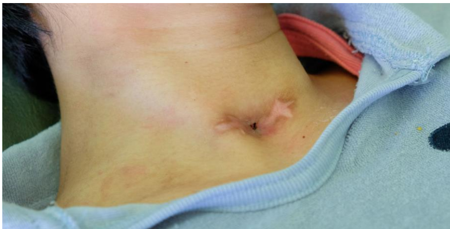
Slika 2: Zatvorena traheostoma