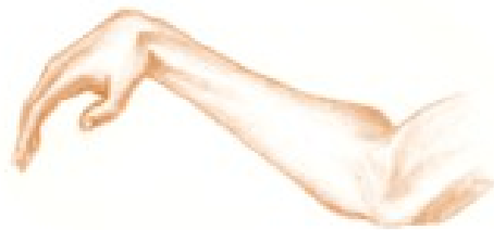
Slika 4 ( Viseća šaka kod pareze nervusa radialisa)

Nervus radialis je najveći živac u ruci i često je ozlijeđen nakon prijeloma, kod korištenja potpazušnih štaka ili dugotrajne kompresije prilikom operativnih zahvata ili sna pod utjecajem alkohola ili droge („paraliza subotnje večeri“). Motorički inervira supinatore podlaktice, ekstenzore podlaktice, šake i prstiju, a senzorno dorzalnu stranu šake i podlaktice te dorzalnu stranu prva dva prsta i radijalnu stranu trećeg. Kod gornjeg oštećenja u aksilarnoj jami dolazi do pareze svih ekstenzora ruke i supinatora podlaktice. Kod srednjeg oštećenja moguća je ekstenzija u laktu, ali ne i u ručnom zglobu i prstima dok je kod donjeg oštećenja oštećena abdukcija palca i ekstenzija prstiju u metacarpophalangealnim zglobovima. Najčešći simptom ovog oboljenja je viseća šaka (Slika 4). U fizikalnom pregledu vidi se, ovisno o razini lezije, slabost ekstenzije i supinacije podlaktice, slabost ekstenzije šake i prstiju te abdukcije palca. Također su mogući osjetni ispadi u području inervacije nervusa radialisa.