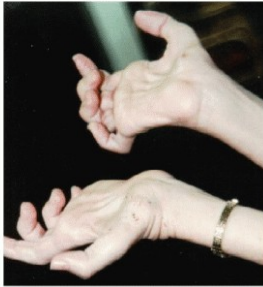
Slika 10 Ruke pacijentice s uznapredovlim stadijem Charcot-Marie-Tooth bolesti( http://charcotmarietoothdisease.org )