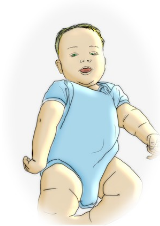
Slika 7 Brahijalna pleksopatije – gornji tip ( http://www.erbpalsy.org )

Kod donjeg tipa lezije zahvaćeni su mali mišići šake i fleksori ruke, te ovakvo oštećenje zovemo Klumpkeovom paralizom. Ovakva oštećenja nastaju kod snažne trakcije prema gore.