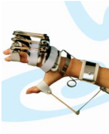
Slika 15 Funkcijska ortoza za šaku ( http://www.orthoaid.co.rs )

Funkcijske ortoze primjenjuju se na razini zapešća i šake. Nadomještaju izgubljenu funkciju i na taj način omogućuju hvat. Statički dijelovi ortoze izrađeni su od termoplastičnih materijala i povezani mehaničkim zglobovima. Dinamički dijelovi su opruge, metaln žice ili neki drugi elastični materijal.