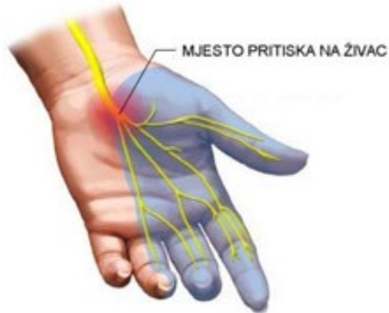
Slika 2 Distribucija neuroloških ispada kod sindroma karpalnog tunela

fleksije prva tri prsta ( šaka propovjednika) i pozitivan Tinelov znak u području karpalnog kanala.