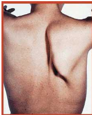
Slika 5 Krilata lopatica kod pareze nervusa thoracicus longusa

Nervus thoracicus longus inervira musculus serratus anterior čija je funkcija izvođenje protrakcije i elevacije lopatice, povlačenje lopatice prema naprijed i fiksiranje uz prsni koš. Kod ozljede nervsa thoracicus longusa donji rub lopatice rotira se gore i medijalno, a medijalni rub lopatice se odvaja od prsnog koša. Stanje se naziva scapula alata. Najčešći uzrok paralize ovog živca su lezije brachialnog pleksusa ili neuralgijska amiotrofija. Bolesnici s ovom lezijom se žale na bol oko lopatice i slabost u ramenu i ruci. Kada pacijent ispruži ruku iz ramena lopatica se odmiče od prsnog koša i pacijent nije u mogućnosti napraviti antefleksiju više od 90 stupnjeva (Slika 5). Pacijent nema osjetne ispade.