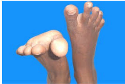
Slika 6 Pareza nervusa peroneusa ( http://www.omjournal.org )

potkoljenice i pozitivan Tinelov znak u razini glavice fibule. Pacijent se može žaliti da se često spotiče ili pada ili da mu stopalo zapinje prilikom hoda uz stepenice. Oštećenja peroneusa najčešće su sekundarna, nakon prijeloma glavice fibule, imobilizacije gipsom, dugotrajnog klečanja, čučanja ili sjedenje sa prekrštenim nogama.