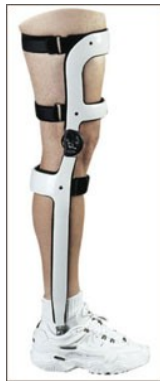
Slika 14 Ortoza za koljeno gležanj i stopalo ( http://www.cascadeorthotics.com )

Ova vrsta ortoza se primjenjuju kod bolesnika s kljenuti donjih udova kao kod Guillain-Barre sindroma. Ortoza za koljeno, gležanj i stopalo, osim što kontrolira kretnje skočnog zgloba kontrolira i koljenski zglob. Postoje dvije manšete koje se pričvrste za natkoljenicu i potkoljenicu povezane dvjema šipkama te je između njih smješten mehanički koljenski zglob.