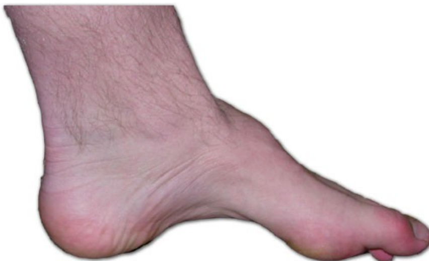
Slika 9 Pescalvus

Charot-Marie-Toothova bolest označava skupinu nasljednih distalnih polineuropatija. Najčešća je nasljedna neurološka bolest i trenutno je neizlječiva. Bolest se očituje progresivnom slabosti u mišićima donjih udova i na kraju atrofijom istih. Najčešći deformitet je pes calvus – stopalo s visokim svodom (Slika 9). Također su prisutni i senzorni ispadi na stopalima i rukama, ali su živci odgovorni za prenošenje boli u potpunosti očuvani. Napredovanje bolesti i njezini simptomi mogu varirati. Kod nekih se javljaju poteškoće kod disanja, kao i kod vida, sluha ili oštećenje vratne i ramene muskulature. Česta je skolioza, a kukovi mogu biti deformirani. Pacijenti s Charcot-Marie-Toothovom bolesti morali bi izbjegavati razdoblja produžene imobilizacije kao npr. kad se oporavljaju od sekundarne ozljede jer produžena imobilizacija ili smanjenje pokreta mogu drastično ubrzati razvoj simptoma. Uzrok Charcot-Marie-Toothove bolesti je mutacija koja uzrokuje defekte u živčanim proteinima.