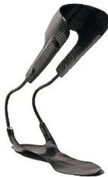
Slika13 Ortoza za gležanj i stopalo ( http://proklinik.com.tr )

Ortoze za gležanj i stopalo se primjenjuju kod ozljeda peronealnog živca. Ovisno o stabilnosti gležnja i parezi stopala izabire se ortoza. U starijih se primjenjuje ortoza za gležanj i stopalo s obručem na potkoljenici i dvije postranično smještene žice koje se povezuju s oprugom u potpetici cipele. Moguća je opcija s ugradnjom mehaničkog zgloba ako je potrebna veća sila podizanja stopala. U mlađih osoba s parezom peroneusa primjenjuje se ortoza od mekih plastičnih materijala koja se nosi u cipeli.