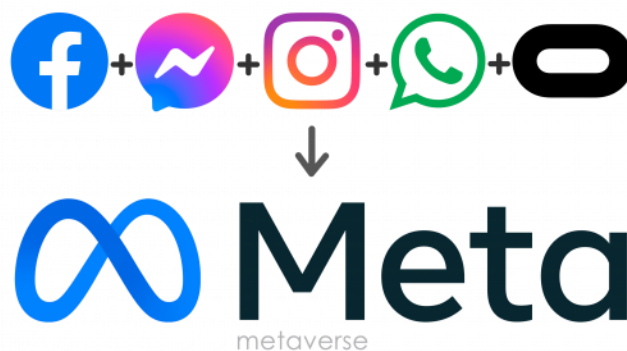
Slika 5. Logo tvrtke „Meta technologies“

U sastavu „Meta tehnologija“ svrha „Instagram“ aplikacije je da inspirira ljude svaki dan. To je aplikacija gdje se njeguje sigurna i inkluzivna online zajednica u kojoj se ljudi mogu izraziti, osjećati se bliže svima do kojih im je stalo i pretvoriti strast u život. (11).