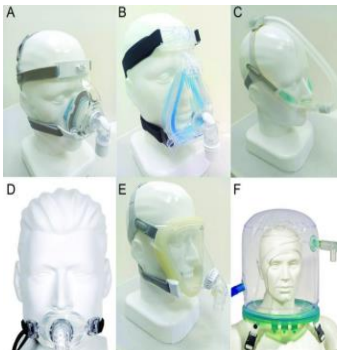
Slika 5. Vrste neinvazivne ventilacije

Respiratorna insuficijencija predstavlja glavnog uzročnika smrti u bolesnika s ALS-om. Napredovanjem bolesti dolazi do manifestacije sve više simptoma koji otežavaju disanje kao što su: disfagija, umor, slabljenje respiratorne muskulature, pojava ortopneje, nakupljanja slina i slično. U procjeni kvalitete disanja rade se plinske analize te krvni forsirani vitalni kapacitet (29). Ovakvim bolesnicima pomažemo pomoću ventilacijske potpore, a jedna od njih je i neinvazivna intermitentna ventilacija (NIV) koja uz pomoć maske za nos i/ili usta preko respiratora olakšava disanje oboljelom. Velika prednost NIV-a je neinvazivnost što smanjuje mogućnost pojave infekcije. Ipak, kao dugotrajno rješenje rabi se traheostoma koja se formira kirurškim postupkom traheostomije, otvaranjem dušnika na prednjoj strani vrata (29).