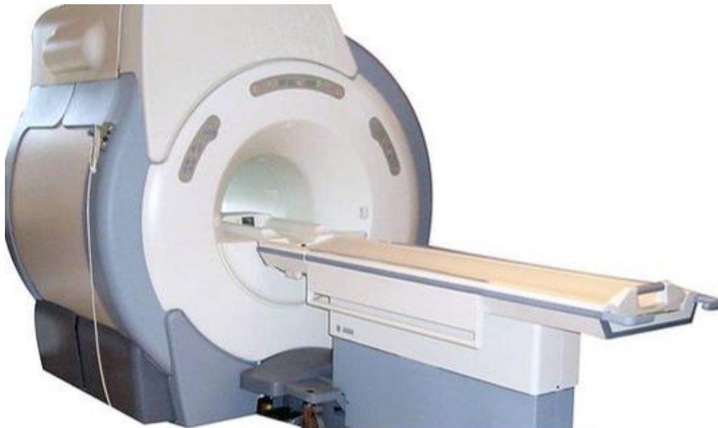
Slika 1. Supravodljivi MR uređaj

Ovisno o tehničkim karakteristikama, MR uređaji se mogu podijeliti na permanente, vodljive i supravodljive magnete. U kliničkoj praksi najčešće se koriste supravodljivi MR uređaji (Slika 1.), supravodljivost se postiže upotrebom navoja izrađenih od slitina titanija, uronjenih u tekući helij čija temperatura je blizu apsolutne nule ( -268\text{ }^{\circ}\text{C} ) (2).