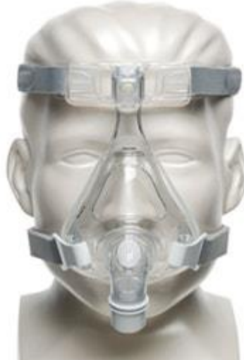
Slika 2. Oronazalna maska.

Usnici su nastavak za usta koji se mogu koristiti na jednostavan način prilikom NIV-a, pogotovo kod bolesnika kod kojih su problemi s disanjem povezani s neuromišićnim bolestima (13). Tijekom dana bolesnicima se nastavak za usta pričvrsti za ventilaciju, a noću se mogu koristiti usnici bez naramenica. Mana usnika je što može doći do propuštanja volumena zraka kroz nos, a takvi problemi se rješavaju povećavanjem dišnog volumena ili zatvaranjem nosnica. Studije su pokazale da je korištene usnika kod tertraplegičara omogućilo uspješan prelazak sa SV na NIV (14). Iako je O 2 široko dostupan, jeftin i siguran način liječenja hipoksemije, važno je spomenuti da se i kod njegove primjene mogu pojaviti komplikacije, hiperoksemije (povećava rizik od smrtnog ishoda), hipoventilacije zbog nepropisne količine O 2 , isušivanja dišnih putova u nosu i usnoj šupljini), pojava želučane insuficijencije (15).