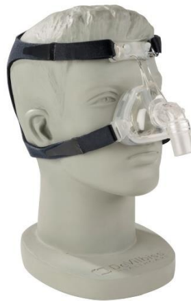
Slika 1. Nosna maska. Izvor: Bauerfeind. Dostupno na adresi:

Nosna maska svoju široku primjenu kod NIV-a ili CPAP -a, pogotovo kada se radi o trajnoj terapiji kod kronične RI. Standarda nosna maska je stožastog oblika napravljena od mekane prozirne plastične maske različitih dimenzija. Svojim oblikom ergonomski prijanja uz nos i stvara zračnu britvu s kožom. Maska za nos stvara pritisak na vrh nosa da bi imala svoju potpunu funkciju, što u nekim situacijama može dovesti i do komplikacija poput crvenila, iritacije ili ulceracije kože lica (9). Na slici 1. prikazana je jedna maska za nos.