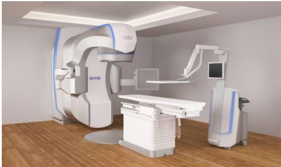
Slika 2. Linearni akcelerator