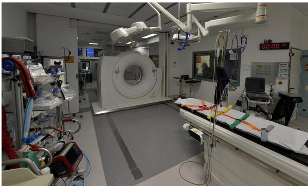
Slika 1. Traumatološka soba opremljena CT uređajem

veći je postotak preživljavanja. Udaljenost veća od 50 metara ima značajan negativan učinak na ishod preživljavanja te je važno da se prilikom planiranja gradnje ili rekonstrukcije odjela hitne pomoći CT uređaji postave u krugu od 50 metara od traumatoloških soba ili po mogućnosti unutar samih soba [22, 23]. Slika 1 prikazuje CT uređaj u sklopu traumatološke sobe.