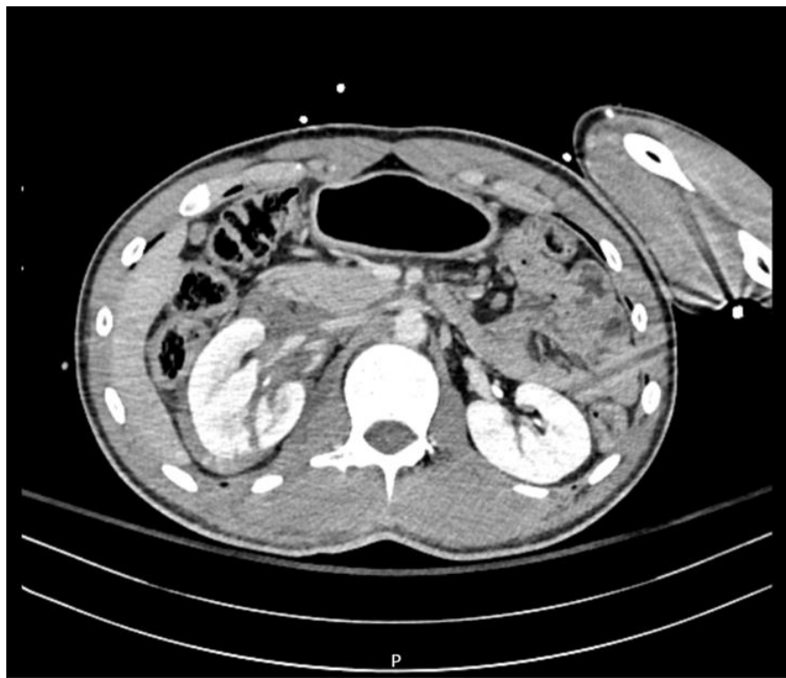
Slika 2. CT aksijalni prikaz duboke laceracije desnog bubrega u srednjem dijelu s perirenalnim hematomom.

Vidljiv i artefakt stranoga metalnog tijela na lijevoj ruci