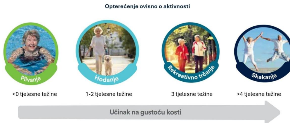
Slika 5 Prikaz razine opterećenja na koštani sustav tijekom različitih aerobnih aktivnosti

Istraživanja pokazuju kako redovito hodanje i drugi oblici aerobnih aktivnosti slabog intenziteta poput plivanja i bicikliranja, imaju mali ili nikakav učinak na usporavanje gubitka koštane mase povezane starenjem. Da bi postigli osteoanaboličke promjene pritisak na kost mora biti 4,2 puta veći od tjelesne težine. Pri stajanju, na kosti djeluje sila gravitacija jednaka našoj tjelesnoj težini, brzo trčanje opterećuje kosti tri puta više od tjelesne težine, dok skakanje ili poskakivanje imaju najbolji osteogeni efekt jer se tako kosti opterećuju preko 4 puta. Aerobni trening u vidu visokointenzivnog i brzog hodanja, isprepletenog s trčanjem, penjanjem uz stepenice i iskoracima, može usporiti smanjenje gustoće kostiju (10,11).