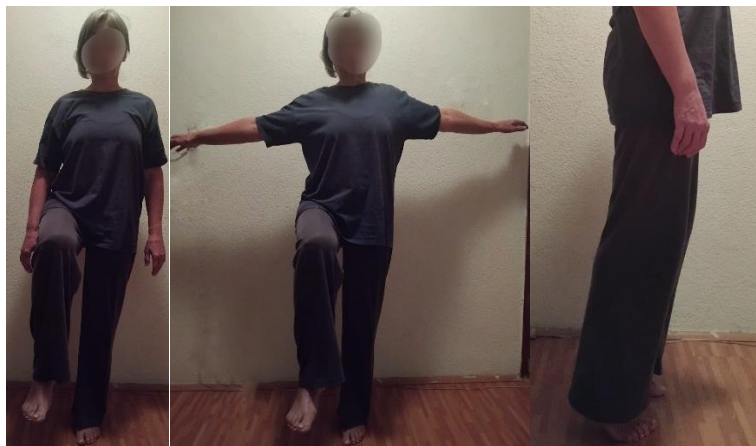
Slika 4 Prikaz primjera vježbi koje poboljšavaju ravnotežu kod osoba s osteoporozom: Stajanje na jednoj nozi, Podizanje na pete/podizanje na prste

Učinkovitost vježbi ravnoteže u prevenciji osteoporotskih prijeloma dokazana je samo kada se kombinira s drugim vrstama vježbi kao što su udarne vježbe, otpora i snage, ali istraživanja pokazuju pozitivne rezultate na smanjenje straha od pada i povećanje tjelesne aktivnosti tokom promatranog period što nam pokazuje kako bi vježbe ravnoteže trebale biti uključene u programe za prevenciju osteoporotskih prijeloma kod osoba starije životne dobi.