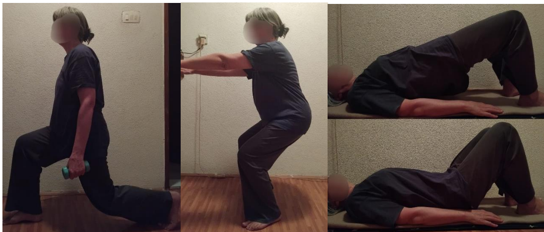
Slika 2 Prikaz primjera jednostavnih vježbi za jačanje mišića donjih udova kod osoba s osteoporozom: iskorak, čučanj, most

kod onih koji su vježbali 2 ili 4 puta tjedno. Vježbe snage: čučnjevi, iskoraci, adukcija/abdukcija kuka, potisak nogama, ekstenzija trupa, plantarna/dorzalna fleksija, trbušne/posturalne vježbe, veslanje, potisak na zid/pod, triceps i abdukcija ramena (11).