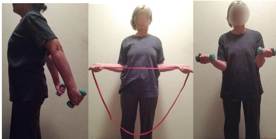
Slika 3 Prikaz primjera jednostavnih vježbi za jačanje mišića gornjih udova kod osoba s osteoporozom: vježba za m. triceps brachii, vanjske rotatore te biceps brachii