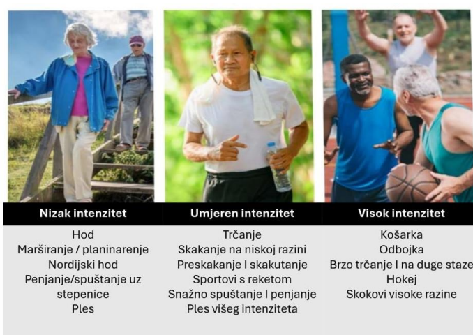
Slika 6 Prikaz primjera aerobnih vježbi prema intenzitetu koje se nalaze u programima za prevenciju osteoporotskih prijeloma kod osoba starije životne dobi

Preporuka za održavanje ili sprječavanje gubitka koštane mase kod osoba starije životne dobi aerobnim vježbama umjerenim ili jakim intenzitetom je 2-4 puta tjedno, 3-5 serija od 10-20 ponavljanja s 1-2 minute odmora između serija. Za učinkovitost potrebno je postupno povećati visinu skoka/ iskoraka ili opterećenje. Prije početka izvođenja vježbi udarnog otpora potrebno je ojačati mišiće donjih udova vježbama snage te ne preskakati vježbe ravnoteže. Osim uz brzi hod, penjanje uz stepenice u ovu skupinu spadaju skokovi, preskakanja, iskoraci te sportske rekreativne aktivnosti koje uključuju trčanje i skokove poput plesa, gimnastike, nogometa, košarke, odbojke, itd. (11).