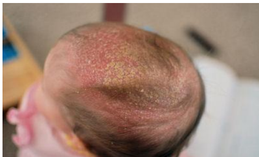
Slika 9. Tjemenica ili crusta lactea