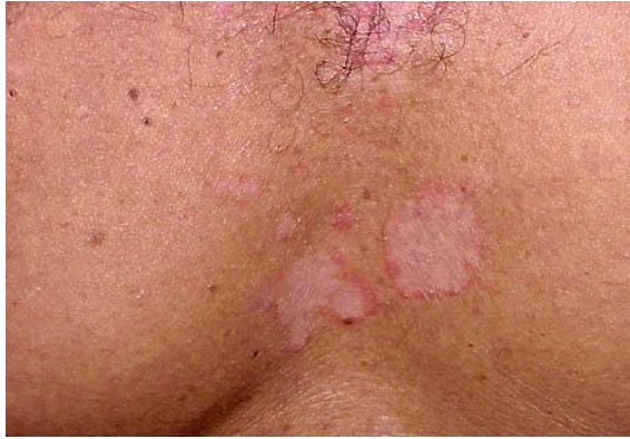
Slika 7. Dermatitis seborrhoica mediothoracica typus petaloides

ograničenom upalnom reakcijom i ljuštenjem te krastama, a u dubini nabora stvaraju se ragade. Češće počinje u vlasištu, a poslije se pojavljuje na drugim lokacijama (3).