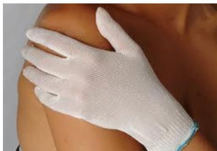
Slika 7. Platnene rukavice za odrasle

i odrasle. To su obično pamučne rukavice koje štite od nastajanja rana i ogrebotina kao posljedica češanja. Pamučne rukavice štite dijete od moguće povrede vlastitim noktima, koja može biti izazvana, još uvijek nekontroliranim bebinim pokretima (7).