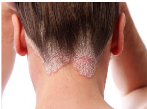
Slika 3. Corona seborrhoica

Na vlasištu se nalaze oštro ograničena žarišta veličine kovanog novca ili još veća žarišta različitih oblika, ružičasto-crvene boje, prekrivena bjelkastožučkastim ljuskama, koja mogu konfluirati. Katkad prekriju cijelo vlasište te prelaze na kožu čela, temporalne, retroaurikularne i nuhalne regije u obliku oštro ograničena crvenkastožučkastog traka uz rub kapilicija širine 1 do 2 cm s izraženim ljuštenjem (corona seborrhoica). U retroaurikularnoj regiji sekundarna infekcija streptokokom izaziva još jače crvenilo i vlaženje, koje se prekriva krastama i ljuskama (streptodermatitis retroauricularis). Seboroični dermatitis vlasišta jačeg intenziteta, klinički pa i histološki, katkad je jedva moguće razlikovati od psorijaze vlasišta. Takvi, prijelazni slučajevi nazivaju se seborrhiasis. Slične se promjene katkad pojave i na licu. Katkad se nađu žarišta okruglasta ili nepravilna oblika veličine kovanog novca prekrivena naslagama bjelkastih ljuščica, koje se sjaje kao čestice azbesta, a ispod njih se nalazi crvena vlažna koža. Takve se promjene zovu pseudotinea amyantacea (3).