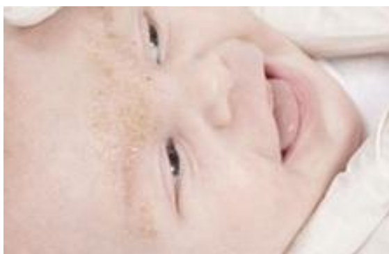
Slika 5. Dermatitis seborrhoica infantum

U dojenčadi, obično u prva tri mjeseca života (najčešće između trećeg i desetog tjedna), promjene počinju u vlasištu pojavom bjelkastih masnih ljusaka do veličine nokta, koje se lagano skidaju. Ako su ljuske deblje i veće, promjene se zovu tjemenica ili crusta lactea, a ispod njih se nalaze eritem i eksudacija. Najčešće je zahvaćen čeonni dio vlasišta s kojeg se promjene šire na lice, na područje obrva, nazolabijalne i mentolabijalnu brazdu, retroaurikularno, u kožne nabore, u pazuha, periumbilikalno, ingvinalno i glutealno. Djetetovo opće stanje nije poremećeno, a rijedak je blaži svrbež. Česte su sekundarna piodermizacija i superinfekcija kandidom. Nakon trećeg mjeseca života promjene postupno regradiraju (3).