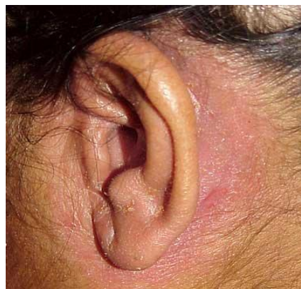
Slika 4. Streptodermatitis retroauricularis

Na licu se promjene najčešće pojavljuju u obrvama, čelu, uz nosna krila, na obrazima i bradi u obliku više ili manje oštro ograničenih ružičastocrvenkastih suhih žarišta uz jedva izraženo perutanje i svrbež. Gdjekad su upalne promjene mnogo izraženije uz naslage krasta. Rubovi vjeđa mogu biti crveni i granulirane površine (blepharitis marginalis) (3).