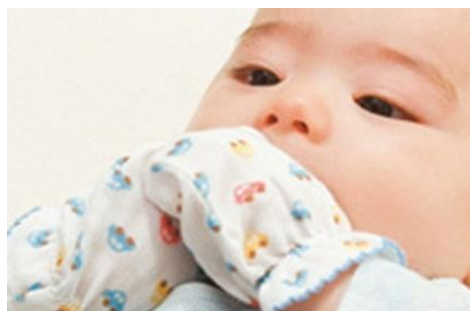
Slika 8. Platnene rukavice za djecu