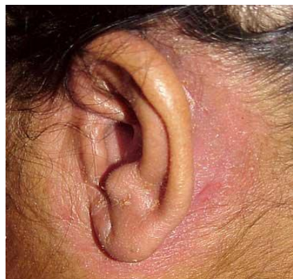
Slika 4. Streptodermatitis retroauricularis

Na licu se promjene najčešće pojavljuju u obrvama, čelu, uz nosna krila, na obrazima i bradi u obliku više ili manje oštro ograničenih ružičastocrvenkastih suhih žarišta uz jedva izraženo perutanje i svrbež. Gdjekad su upalne promjene mnogo izraženije uz naslage krasta. Rubovi vjeđa mogu biti crveni i granulirane površine (blepharitis marginalis) (3).