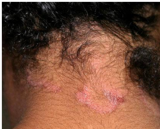
Slika 6. Dermatitis seborrhoica colli perstans

Dermatitis seborrhoica colli perstans je oblik seborojičnog dermatitisa, koja se pojavljuje u žena na vratu u obliku tankih, svijetlosmeđih do žućkastih oštro omeđenih suhih naslaga (3).