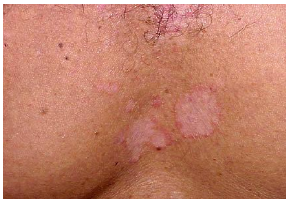
Slika 7. Dermatitis seborrhoica mediothoracica typus petaloides

ograničenom upalnom reakcijom i ljuštenjem te krastama, a u dubini nabora stvaraju se ragade. Češće počinje u vlasištu, a poslije se pojavljuje na drugim lokacijama (3).