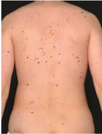
Slika 10. Sindrom displastičnog nevusa