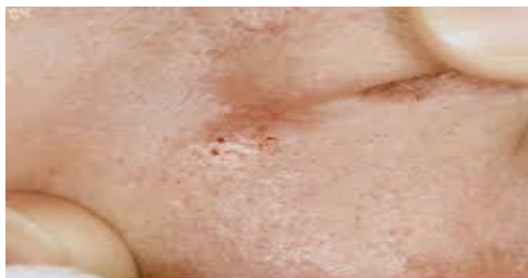
Slika 7. Morfeiformni oblik

Basalioma morpheiforme najčešće se pojavljuje na koži lica, nosa, čela i obraza u obliku atrofičnog ožiljka (slika 7). Lokalno je agresivan, sklon širenju u dublje strukture. Diferencijalna dijagnoza mu je dermatofibrosarkom (1).