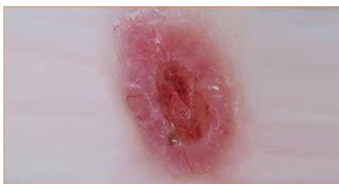
Slika 6. Superficijalni oblik

Basalioma superficiale ili površinko-šireći je baziloma koji najčešće nastaje na koži trupa, a može se uočiti i na udovima i licu u obliku eritematoznog, oštro ograničenog žarišta (slika 6.) Pojava ove vrste baziloma najčešće se povezuje s kroničnom ekspozicijom arsenu. Diferencijalna dijagnoza mu je Pagetova bolest, Bowenova bolest, psorijaza (1).