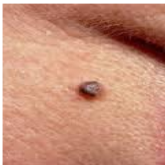
Slika 4. Pigmentirani oblik BCC