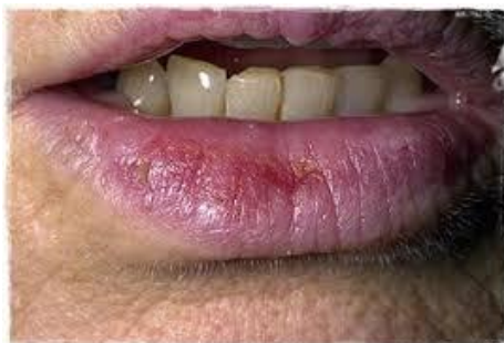
Slika 8. Planocelularni karcinom donje usne

1) na donjoj usni - pojava papula i erozija znak je tumora (slika 8.)