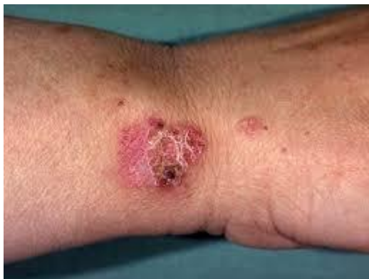
Slika 1. Morbus Bowen

KLINIČKA SLIKA: Bolest se najčešće očituje kao pojedinačni plak promjera nekoliko milimetara do nekoliko centimetara. Oštro je ocrtan, različita oblika. Obično je nešto uzdignut, površina je pokrivena sivkastim ili žutim ljuskama i krasticama (slika 1.) Rijetko se vidi ulceracija, ona upozorava na prelazak u invazivni karcinom. Bolest se može pojaviti na svakom predjelu kože ili na sluznici. Najčešće je smještena u predjelu lica, trupa ili u predjelu udova.