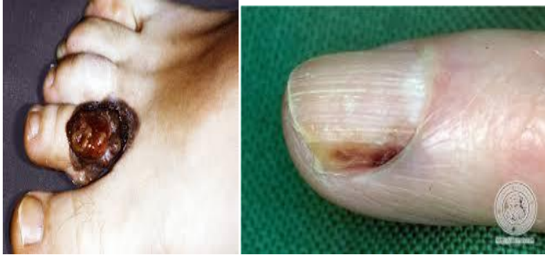
Slika 15. Akrolentigiozni melanom