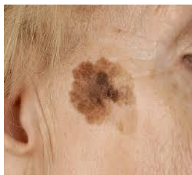
Slika 12. Lentigo melanoma