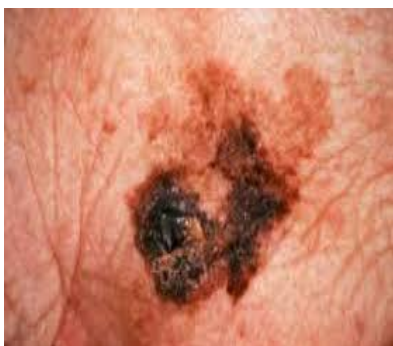
Slika 11. Lentigo melanoma

To je melanoma in situ obilježena prolongiranom radijalnom fazom rasta. Nakon nekog vremena može prijeći u invazivni melanom (LMM). LM se opaža u šestom ili sedmom desetljeću u osoba u kojih je izražena solarna degeneracija, ponajprije u predjelu lica. Očituje se neoštro ograničenom makulom u kojoj se mogu opaziti svijetlosmeđi, tamnosmeđi i crveni areali. Ne uzrokuje simptome, iako svrbež može upozoriti na početak vertikalne faze rasta (1). Pojava eleviranih areala upućuje na prelaz u LMM. Diferencijalan dijagnoza LM obuhvaća pigmentiranu seboroičnu keratozu, pigmentiranu aktiničku keratozu i solarni lentigo.