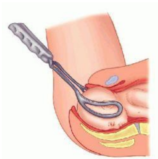
Slika 3. Forceps