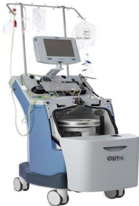
Slika 2. Stanični separator Spectra Optia [7]

COBE Spectra (Caridian BCT, Lakewood, CO, SAD) je sustav s kontinuiranim protokom koji koristi separacijsku komoru u obliku omče i zahtijeva dvostruki venski pristup. Cobe Spectra ima dva programa za prikupljanje KMS. MNC program (verzija 4.7, 5.1, 6.1 i 7.0) koristi jednokanalnu separacijsku komoru, a Auto PBSC program (Version 6.1) koristi dvokanalnu separacijsku komoru. MNC program je poluautomatski pa operater može nadzirati prikupljanje stanica uz kolorogram (engl. colored scale). Operater podešava protok pumpe separatora i na taj način nadzire boju produkta u liniji za prikupljanje. Produkt treba biti svijetlo ružičaste boje što odgovara vrijednosti hematokrita od 2 do 3%. Auto PBSC program u cijelosti automatski nadzire postupak prikupljanja na osnovi podataka o bolesniku i broju stanica u perifernoj krvi koji su uneseni na početku procedure.