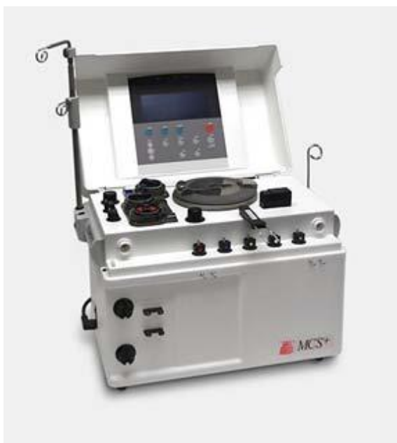
Slika 8. Stanični separator Haemonetics MCS plus [7]

Haemonetics MCS Plus (Haemonetics Corp., Braintree, MA, SAD) je separator s intermitentnim protokom koji za separaciju krvi koristi Lathamovu kuglu u obliku zvona. Zbog diskontinuiranog protoka krvi koristi samo jedan venski pristup, ali postupak leukafereze zbog toga traje značajno duže. [7]