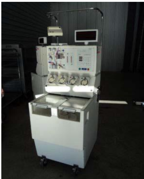
Slika 6. Stanični separator Fresenius AS 104 [7]

Fresenius AS 104 (Fresenius USA, Walnut Creek, CA, SAD) je stanični separator s kontinuiranim protokom koji koristi dvostupanjsku separacijsku komoru. U prvoj fazi prikuplja se plazma bogata trombocitima i mononuklearnim stanicama koje se koncentriraju u slijedećoj fazi.