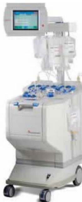
Slika 5. Stanični separator Amicus [7]

Fresenius AS 104 (Fresenius USA, Walnut Creek, CA, SAD) je stanični separator s kontinuiranim protokom koji koristi dvostupanjsku separacijsku komoru. U prvoj fazi prikuplja se plazma bogata trombocitima i mononuklearnim stanicama koje se koncentriraju u slijedećoj fazi.