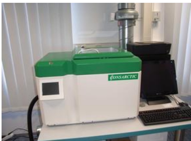
Slika 8. Biofreeze BV 40 [19]

Slika 8. Prikazuje sustav s kontroliranom brzinom zamrzavanja živih bioloških uzoraka (stanice, tkiva) do kriogenih temperatura (do -196^{\circ}\text{C} ). Cijeli postupak zamrzavanja je pod računalnom kontrolom, nadzire ga glavni računalo tipa CPR i kontrolira koprocesor CST05. [19]