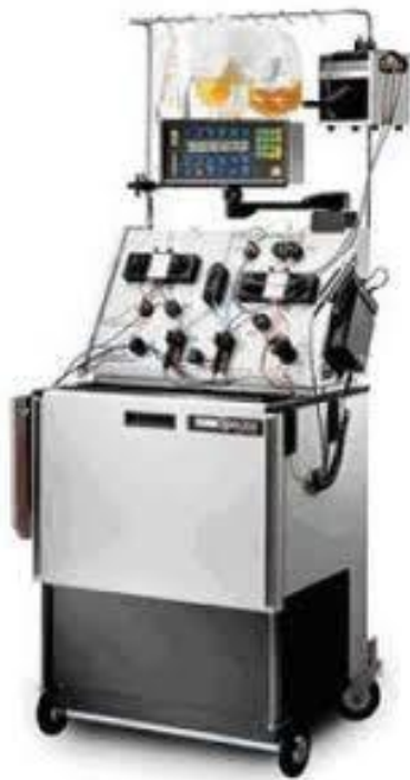
Slika 3. Stanični separator COBE Spectra [7]

Baxter CS 3000 Plus (Baxter Biotech, Deerfield, IL, SAD) je stanični separator s kontinuiranim protokom s dvije serijske separacijske komore za izolaciju mononuklearnih stanica. Amicus (Baxter Biotech, Deerfield, IL, SAD) je separator nove generacije koji automatski prikuplja mononuklearne stanice s jednostrukom komorom, a proces izdvajanja odvija se u fazama. Mononuklearne stanice se intermitentno prikupljaju u vrećicu s produktom.