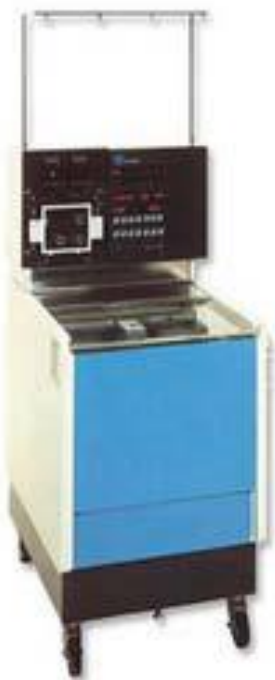
Slika 4. Stanični separator CS 3000 Plus [7]