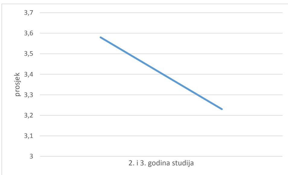
Slika 3. Motivacija za nastavkom studija studenata druge i treće godine

Zatim su testirane razlike po česticama u motivaciji (tablica 6) i zadovoljstvu (tablica 7) pri čemu su dobivene statistički značajne razlike na sljedećim česticama: